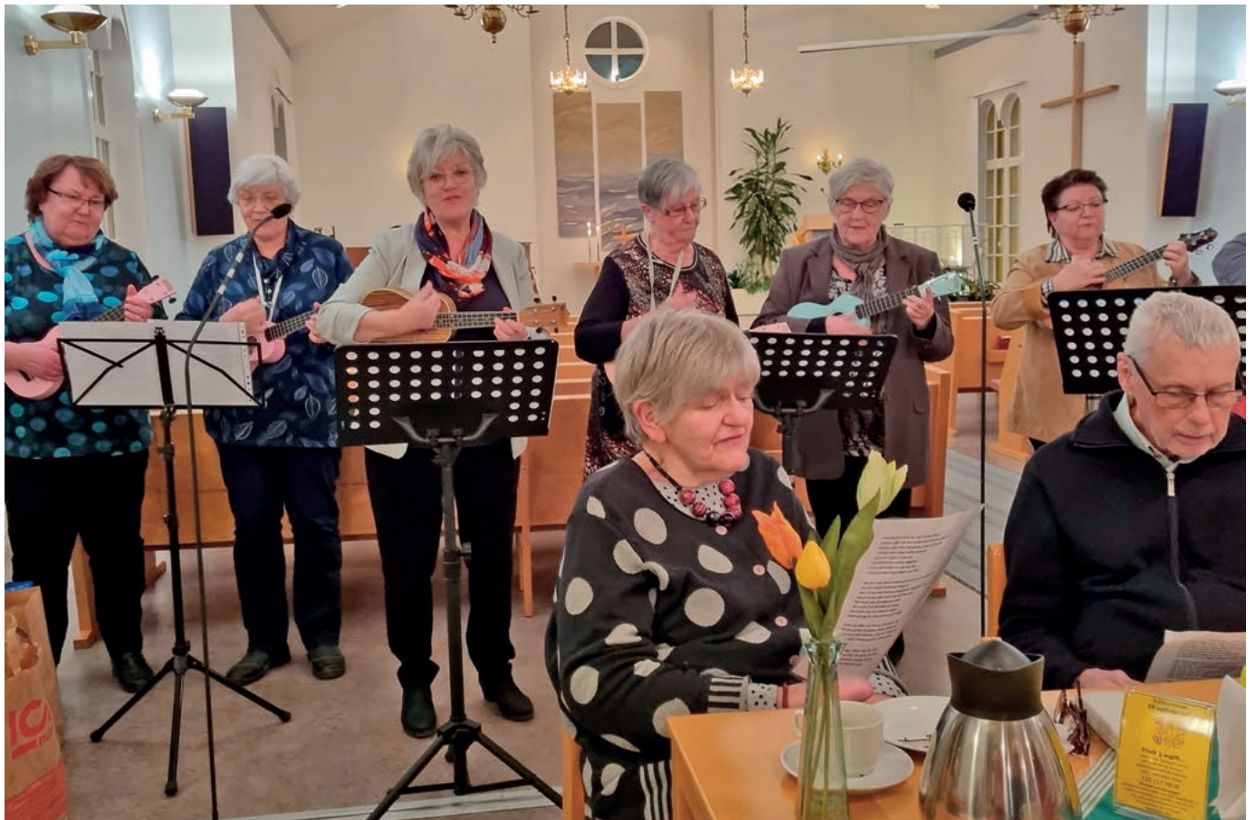
Ukelelegruppen spelade upp efter årsmötet.