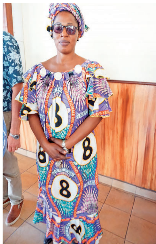
Klänningar med 8:e mars motiv syns överallt i Brazzaville.

– Många av dessa kvinnor är helt utbildade. Vi undervisar dem i bibelhistoria och kyrkans lära. De får lära sig om hälsa, matlagning, sömnad, virkning, konfliktlösning och vid behov, viss alfabetisering.