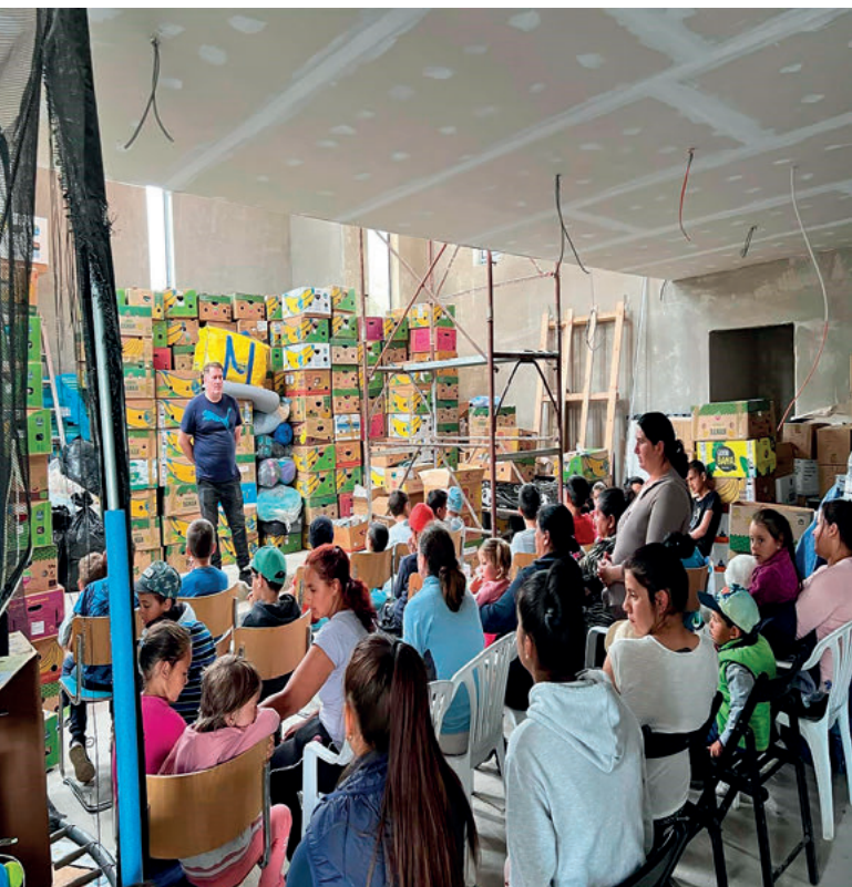
Mängder med förnödenheter och mängder med frivilliga hjälper till i Cluj Napoca.