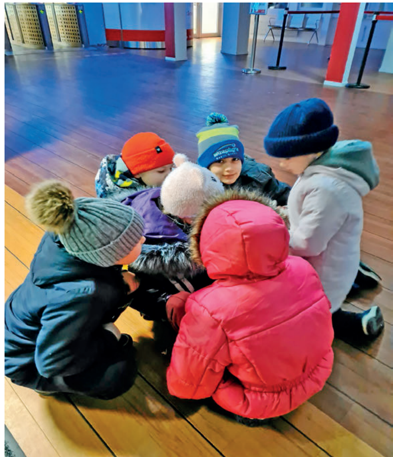
Ukrainska barn i ankomsthallen vid färjeläget i Karlskrona.

Jag står kvar, rörd och överväldigad. Men jag gjorde ju inget? Jag var bara där! Men det var kanske det hon behövde. Nån som bara var där, som såg henne och pojken. Nån som såg dem som de var.