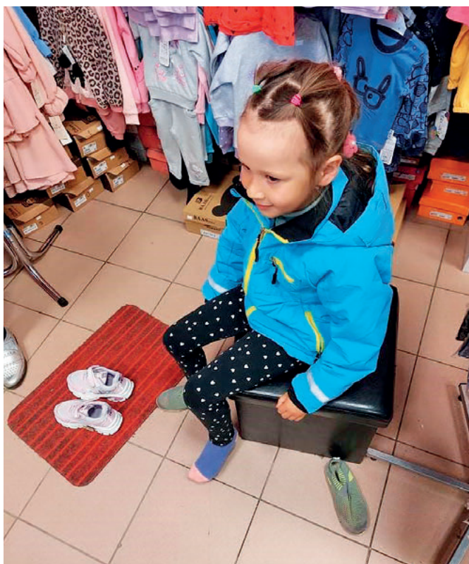
Nya skor och en stunds gemenskap i vårsolen. Hjälparbetet i Litauen har många goda sidor.