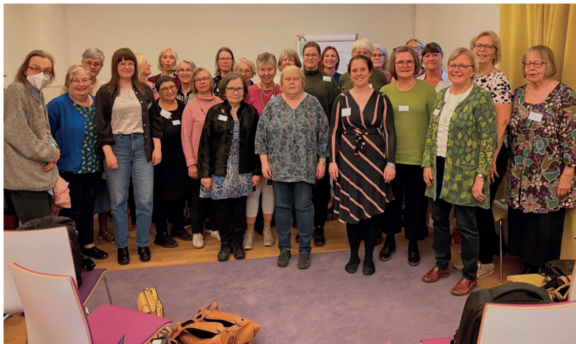
Hela SEK:s årsmöte på en och samma bild.