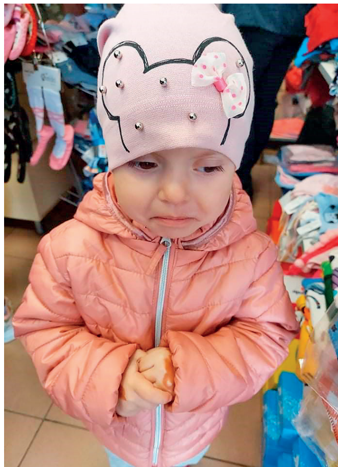
Många ledsna barn och mammor får hjälp på Pagalbos.