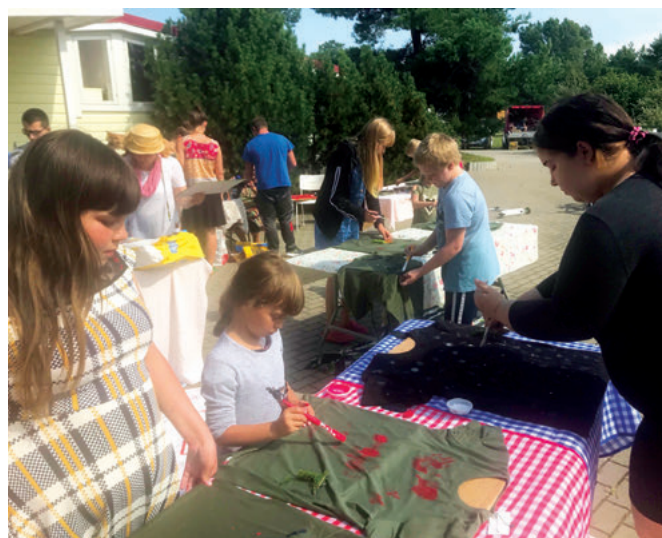
Panevezysförsamlingens familjeläger kunde genomföras.