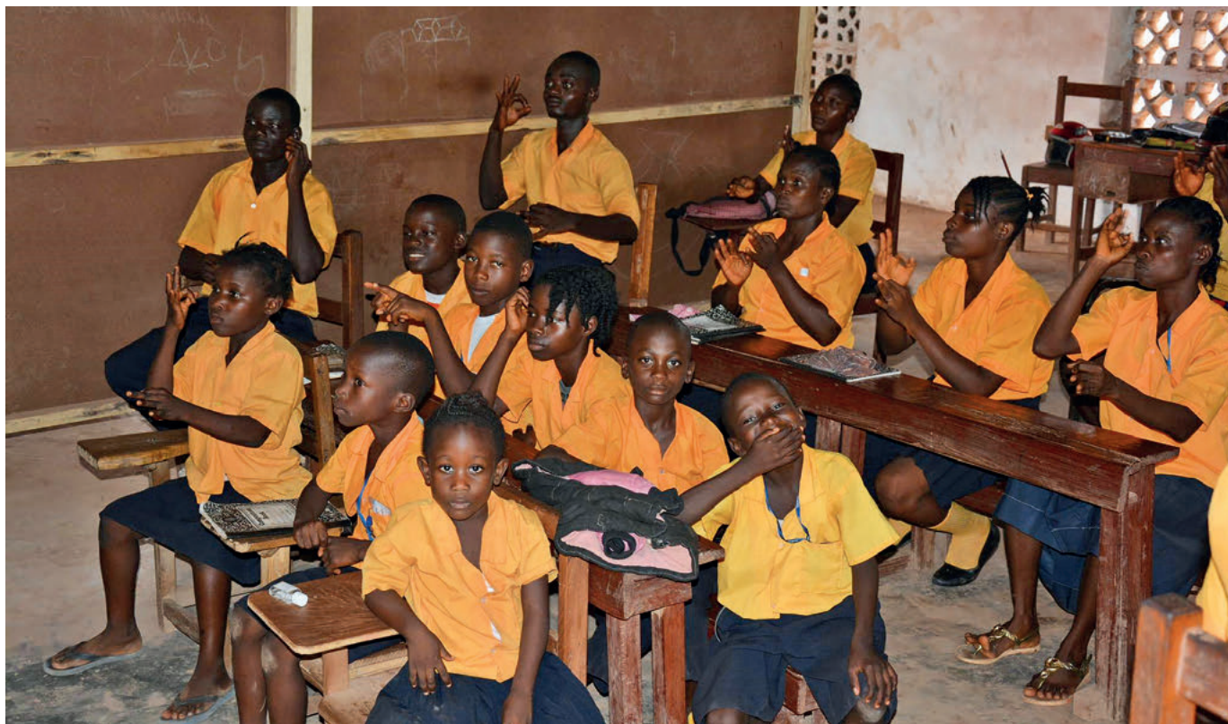
Elever i dövskolan.