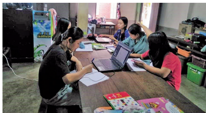
Självstudier på elevhemmen under pandemin.

Vid alla elevhemmen, i Sible, Mae Sariang och Sop Moei, har elevhemsföräldrarna ett stort ansvar och brottas ständigt med nya utmaningar. Ny teknik och nya levnadsvillkor kräver kre-