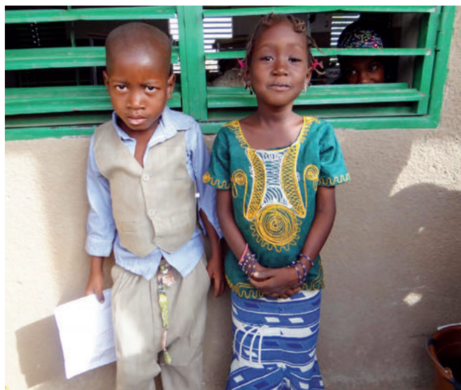
Barnen i Semendua kämpade både mot parasiter i blodet och malaria.

Nu var det dags att öppna mottagningen. Vi tog emot mellan 100–150 patienter per dag. Utrustningen var mycket enkel, men trots det kunde vi diagnostisera och behandla många sjukdomar så som malaria, olika maskar i