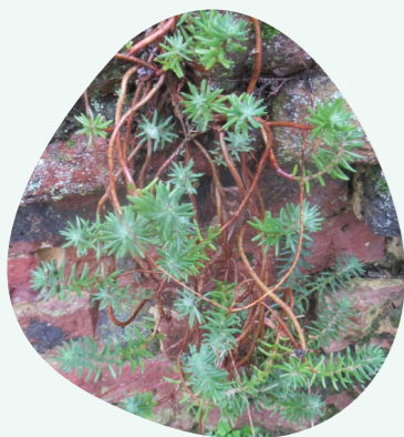
Orpin des rochers Sedum rupestre