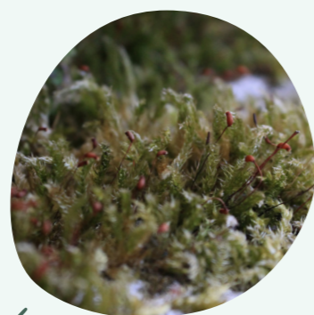
Mousse Brachythecium rutabulum