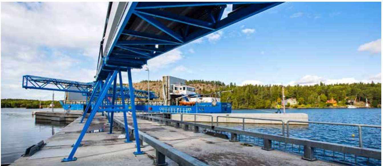
Berget som vi sprängt ut i tunneln krossas till mindre stenar. Stenkrossen åker sen med ett transportband från tunneln till våra fartyg.

Nu är bygget av E4 Förbifart Stockholm i full gång, från Häggvik i norr till Kungens Kurva i söder byggs trafikplatser och tunnlar.