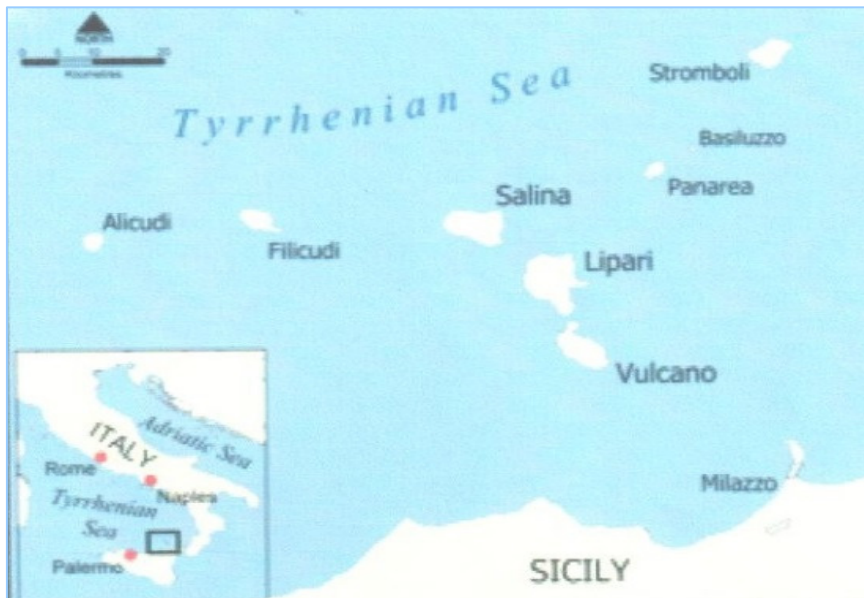
Lipariska öarna norr om Sicilien!

Vi stannade 15 dagar på Malta. Cyklade, åkte runt med buss och tog del av de dramatiska händelserna knutna till korsriddartiden. Så var det dags att segla till Sicilien igen. En intressant stad var Siracusa (Syracusa) där matematikern Arkimedes verkade under den Grekiska tiden. Helgonet Lucia kom från denna stad. Hennes överarmsben finns att beskåda i en av kyrkorna där. Nästa intressanta hamn blev Catania, som ligger nedanför vulkanen Etna. Man kunde ta bussen högt upp och sedan vandra till fots mot kratern tills "orken" tog slut. Framför oss låg nu Messina sundet som vaktas av Skylla och Carybdis. Strömmen är ofta mycket stark i sundet och på grund av en uppgrundning just på det smalaste stället bildas här virvlar och "toppiga" vågor. Vid passagen fick vi uppleva att Etna fick ett mindre utbrott just då! Vi såg rökmoln samt röd lava som ringlade nedåt. Vilken tur att detta utbrott inte kom, när vi vandrade där! Vårt mål var nu de "Lipariska" öarna som ligger utanför Siciliens norra kust. De består av 7 stycken vulkaniska öar, av vilka "Stromboli" är den mest kända (filmen "Stromboli" med Ingrid Bergman!) Den mest sevärda ön är "Vulcano" som har en snäll vulkan. Man kunde klättra upp till kraterranden och se de andra öarna. 12 km tur och retur. Kläderna lukade dock svavel och fick tvättas efteråt.