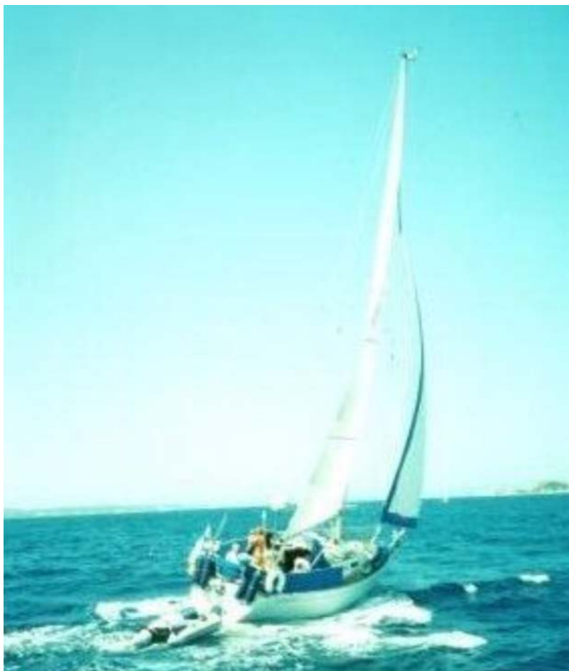
Vår Omega 36 "La Mouette" under segel!

Efter radarinstallationen "gick" vi till Klubbholmen för tankning och stannade sedan där över natten. Dagen därpå anträdde färden till Medelhavet via Södertälje, Kielkanalen, Nordsjön, Engelska kanalen, Biscaya, Spanska & Portugisiska Atlant kusten och in genom Gibraltar Sund. Vi hade studerat möjligheten att gå genom Europas kanaler men fann dels att den vägen var besvärlig och tidvis ganska trist, dels att vår mast på 18 m skulle sticka ut ca 3,5 m både fram och bak – lika med stor risk för skador i slussarna. Strategin var att segla med förlängd semester ca sex, sju veckor de två första somrarna, därefter (efter pensionen) från april tom augusti när stormar är sällsynta i Medelhavet.