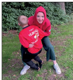
Billeder fra Familielejr i Helsingør