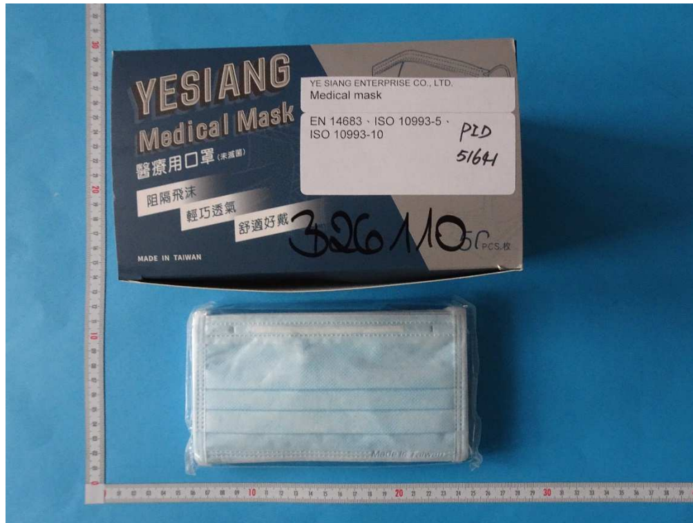
Abb. 1: YE SING ENTERPRISE., CO LTD / Medical mask