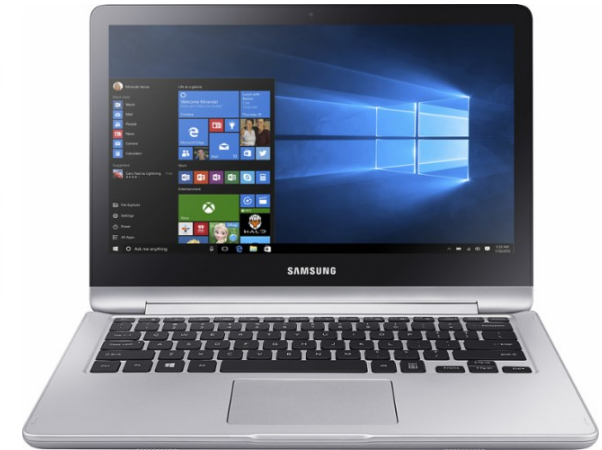
das Notebook, -s