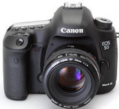
die Digitalkamera, -s