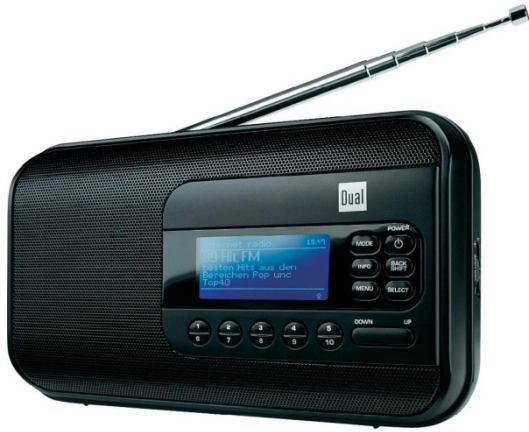
das Radio, -s