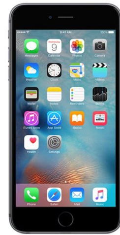
das Smartphone, -s