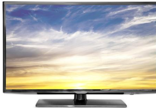
der Fernseher, -