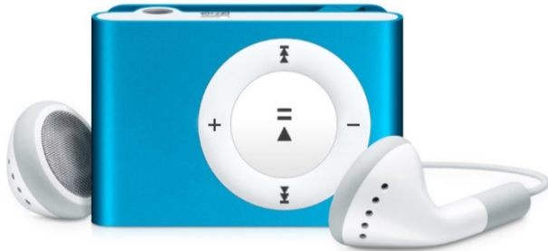
der MP3-Player, -