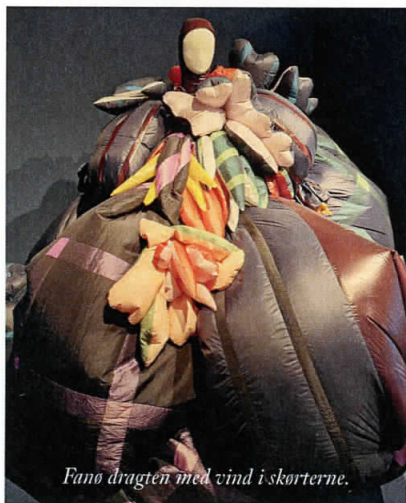
Fano dragten med vind i skørterne.

Lidt forenklet kan man spore kilden til inspirationen i dragterne i arkitektur (Roskilde, Nørrebro), emotionelt (Randers, Århus, Strynø), i erhverv (Sønderborg, Herning, Billund, Ærø, Svanholm, Hirtshals), og trendy tendenser (Aalborg, Valby, Christiania, Vollsmose). Nok ikke alle lokale vil være enige i præsentationen af deres sted. Mon beboere i Tisvilde synes, at en kulørt badekåbe er samlende