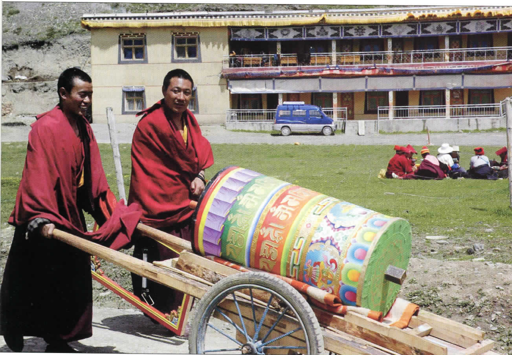
To munke fra en mindre tibetansk landsby i det tidligere i Kham, et område i det nuværende nordvestlige Sichuan. De to er på vej til et kloster med to bedemøller, der skal sættes op i muren omkring klostret, der er vist på den foregående side. (Foto: Ellen Bangsbo).

En af de tibetanske buddhisters store religiøse fester, Shoton-festen, holdes hvert år i august ved Drepung-klostret uden for Lhasa. Tidligt om morgenen fremvises en stor thanka – et billede malet på lærred. Det er en religiøs tradition, der er et vigtigt samlingspunkt med deltagelse af mange tusinde troende. (Foto: Ellen Bangsbo).