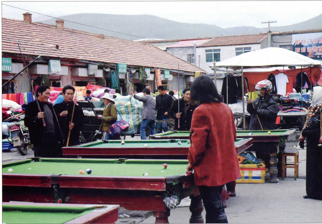
Et slag billard i Amdo-området: Mange tibetanere er arbejdsløse og fordriver tiden ved billardborde opstillet på en markedsplads eller langs vejene.

Jeg var tilfældigvis i Tibet på dette tidspunkt, og det var fascinerende at se røgen stige til vejrs fra utallige bjergtoppe i mange miles omkreds. Sådanne spontane og fælles markeringer af tibetanskhed er medvirkende til, at tibetanere oplever et etnisk sammenhold. Sådanne former for tra-