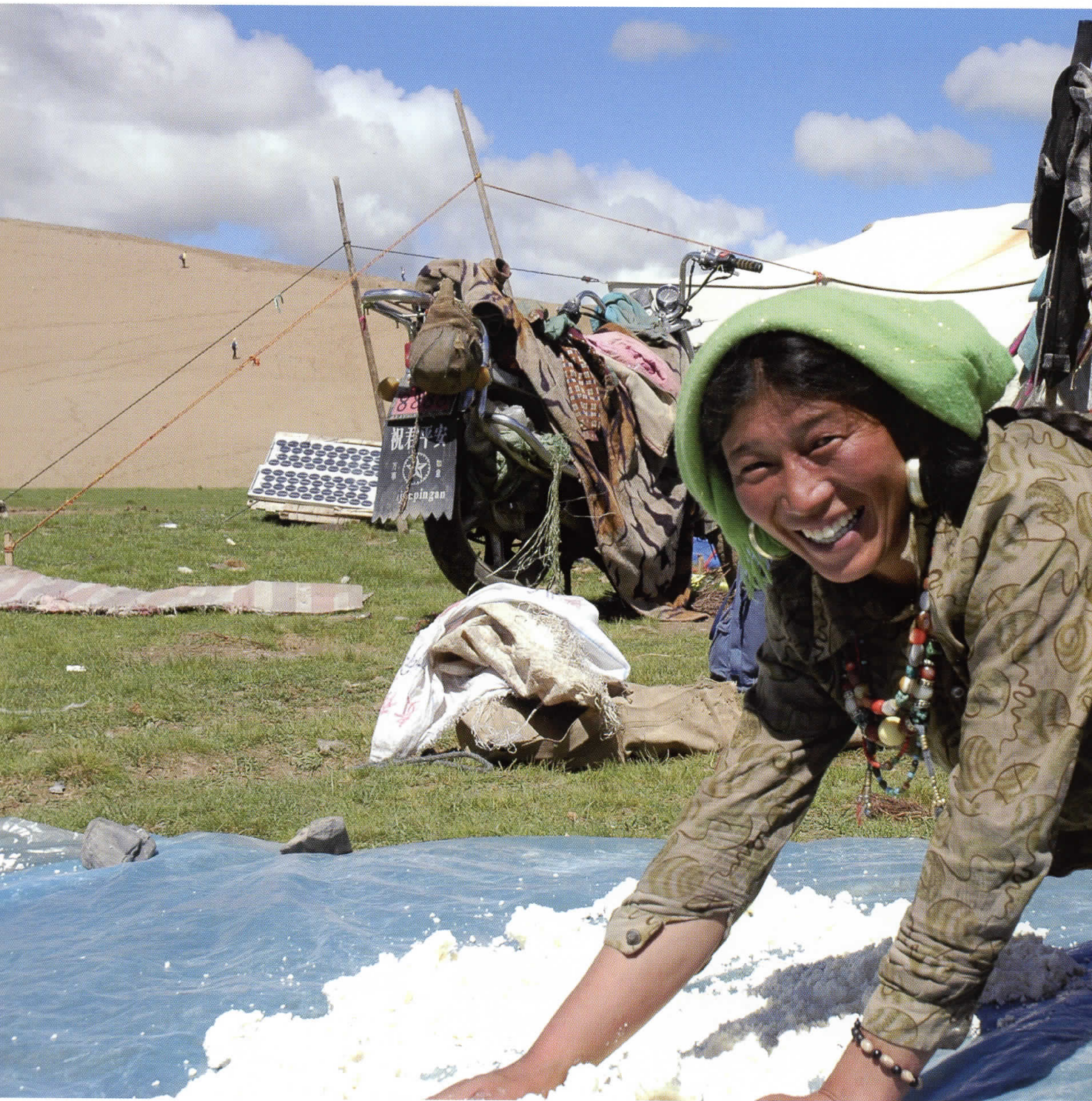
Tibetansk nomadekvinde spreder tibetansk ost ud til tørring i solen.