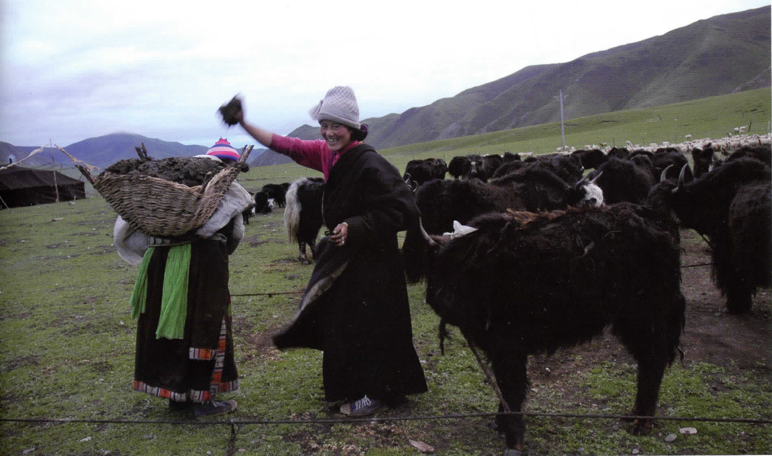
Daglige pligter for nomadekvinder inkluderer stadig indsamling af yakgødning, der bruges til brændsel. Det ser charmerende ud, men er hårdt og beskidt arbejde – og koldt i vintermånederne.

strene ikke længere har indtægter som jordbesiddere, forsøger de i stedet at få en indkomst ved, at nogle munke kører taxakørsel, eller at klosteret har anlagt en benzintank, hvor munkene service-rer kunderne.