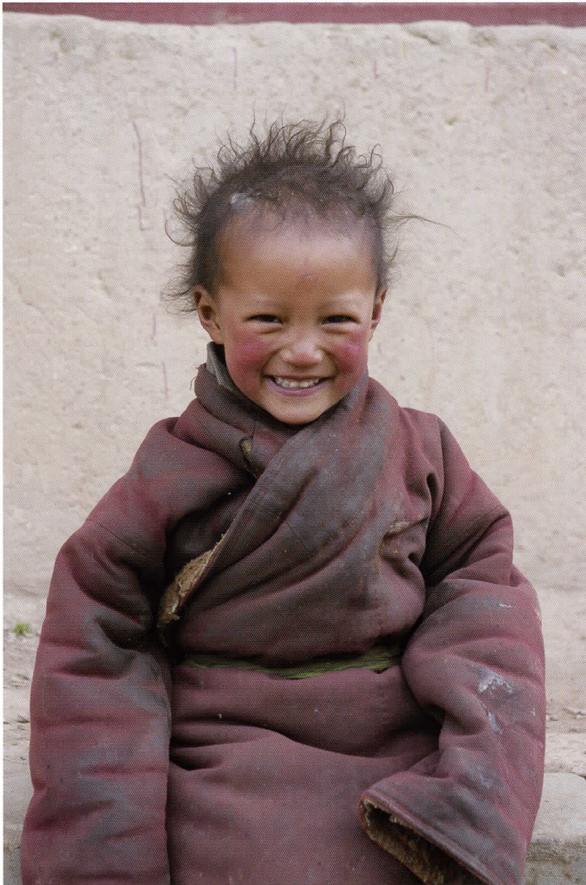
Lille glad nomadepige, der endnu er for ung til at gå i skole.

Hele det tibetanske etniske område dækker et langt større areal end det nuværende Tibet (Tibets Autonome Region). Der bor ca. 5,8 millioner tibetanere i Kina, men heraf bor kun 2,7 millioner tibetanere i selve Tibet. Over halvdelen af alle tibetanere i Kina er således bosat i provinserne Qinghai, Sichuan, Gansu og Yunnan.