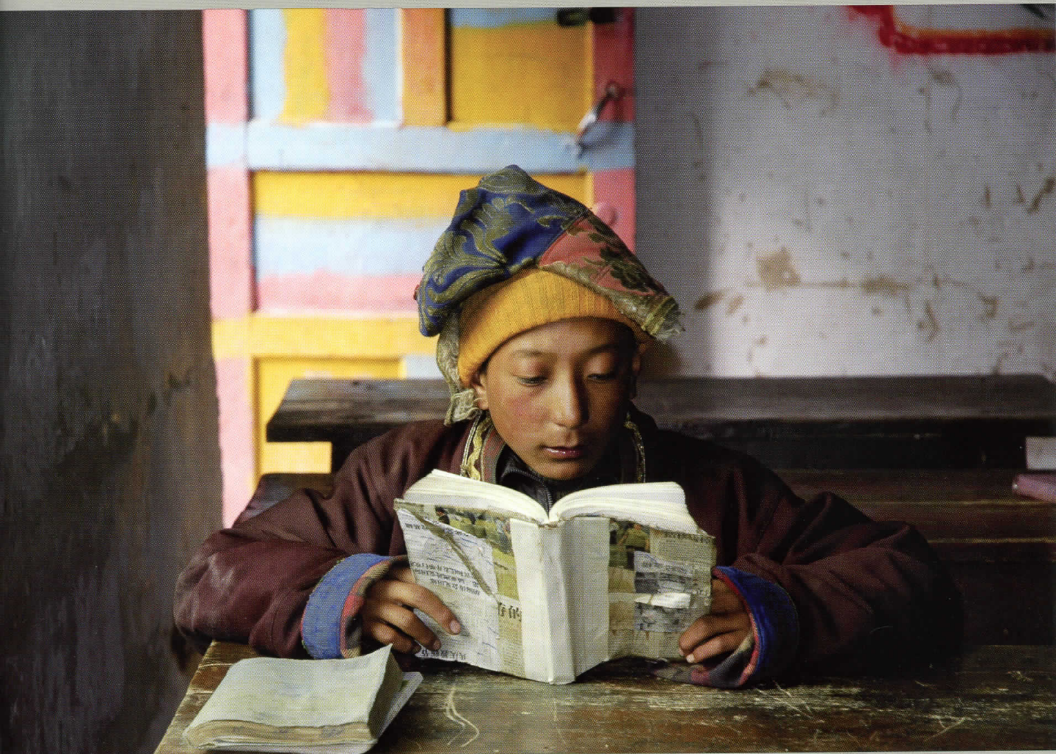
En dreng læser sine lektier en sen eftermiddag i den lille landbyskole for nomadeborn.

Se alle billederne på: http://etnografiskforening.dk/udstilling.php