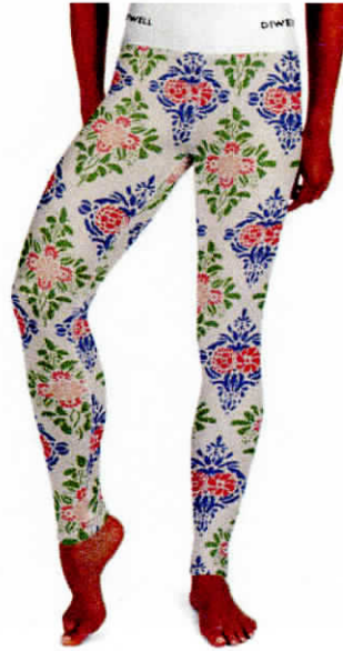
Jonas Wallströms kendte skabelonmønster fra tapetet i Gästgivars gården. Her gengivet på gamachebukser.

Tilbage til Hälsingland gårdene.... I 1700-tallet var man begyndt at lave skabelonmalede rullegardiner. Men eftersom der ofte var så mange farver på spil i tapetet, brugte man på gårdene tit hvide gardiner til vinduerne. Farverne i tapeterne blev som regel afspejlet i rummets interiør, specielt i tekstilerne: Sengetæppet, borddugen, kludetæppet på gulvet mm. De smukke håndtrykte eller malede tapeter bør derfor opleves som en samlet enhed, hvor alt interiør i rummet på smuk og forunderlig vis spiller sammen i en indbyrdes harmoni.