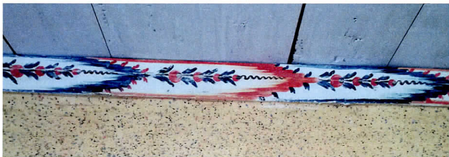
Stænkmaleet tapet med malet bort ved loftet.

Marmorering har til formål at imitere marmor eller anden form for stenmateriale. Teknikken er gammel og blev brugt på slotte og herregårde i 1600- og 1700-tallet, men blev anvendt helt frem til ca. 1920'erne. For at opnå et godt resultat i marmorering kræves erfaring og talent. Grundfarven er ofte grå, som marmor, og derpå males striber, som udviskes med en svamp eller en klud. På gårdene brugtes marmorering ofte som effekt i et bundpanel, med skabelonmalede tapeter eller landskabsmaling på væggen over panelet.