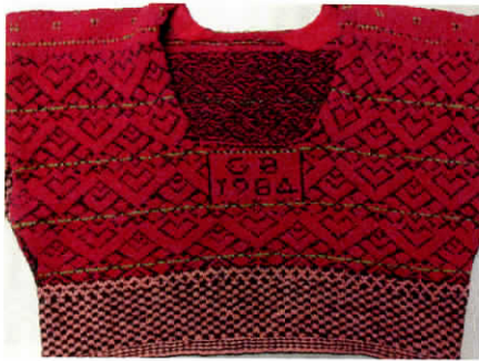
Strikket trøje i tvebinding fra Hälsingland, Foto: Ellen Bangsbo.