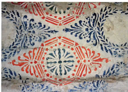
Skabelontrykkeri direkte på væggen i Bortom Åa gården.