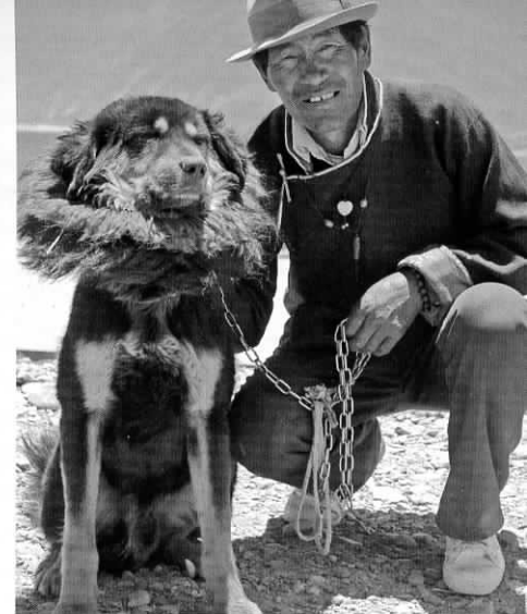
Fra venstre: Hund ved et tibetansk nomadetelt. Tibetaner med sin mastiff hund ved Yamdrok Tso.

uden at være sat for meget i lænke, kan den godt være kælen eller i det mindste fredsommeligt for de personer, den tydeligvis kan fornemme er velkommen hos dens ejer. Selv har jeg mødt både bidske og kælnede tibetanske mastiff, men jeg har aldrig strakt hånden ud mod en mastiff før jeg har opholdt mig en del tid i dens territorium og sikret mig, at den ved jeg er der som en velkommen gæst. Generelt er den dog ret reserveret overfor fremmede. Som de fleste andre hunde i de asiatiske områder, sover den om dagen, for at den kan være mere vagtsom om natten og med sin larmende gøen, nærmest som et tågehorn, forhindre besøgende gæster eller andre i at få en god nats søvn. Den kan leve i 10-14 år, hvilket er et langt hundeliv for en hund af den størrelse.