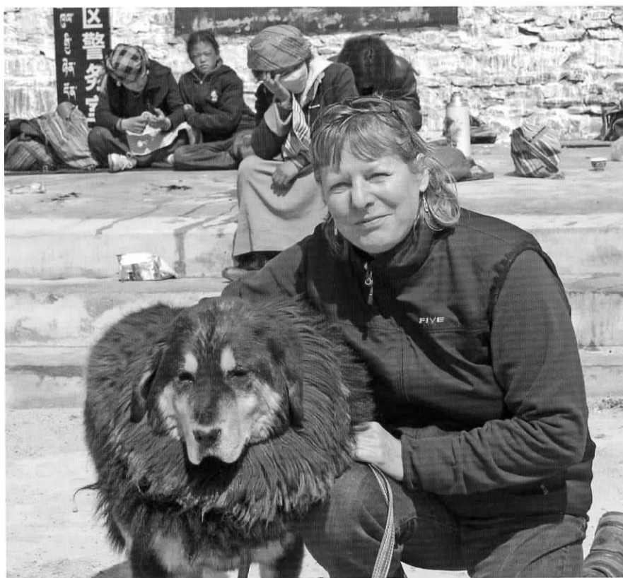
Artiklens forfatter i selskab med en gammel skikkelig Mastiff hund ved Yamdrok Tso, Tibet 2010.

Den tibetanske mastiff siges at have en stamtavle på op mod 3.000 år. Generelt findes der to typer af den tibetanske mastiff: »Do-khyi«, som ofte refererer til nomadernes hunde, og »Tsang-khyik«, der som navnet antyder stammer fra Tsang og er en noget større og tungere hund. Hanhunde kan blive op til 80 cm