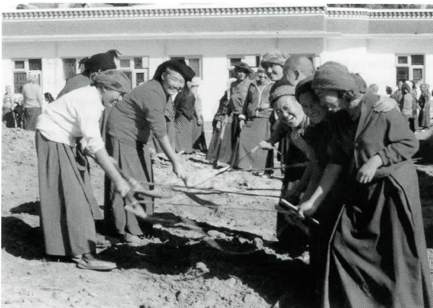
Praktisk arbejde er en del af livet i et nonnekloster.

En af hovedårsagerne til nonners lave sociale status kan forklares ud fra den traditionelt lavere status for kvinder i det tibetanske samfund. Det skyldes