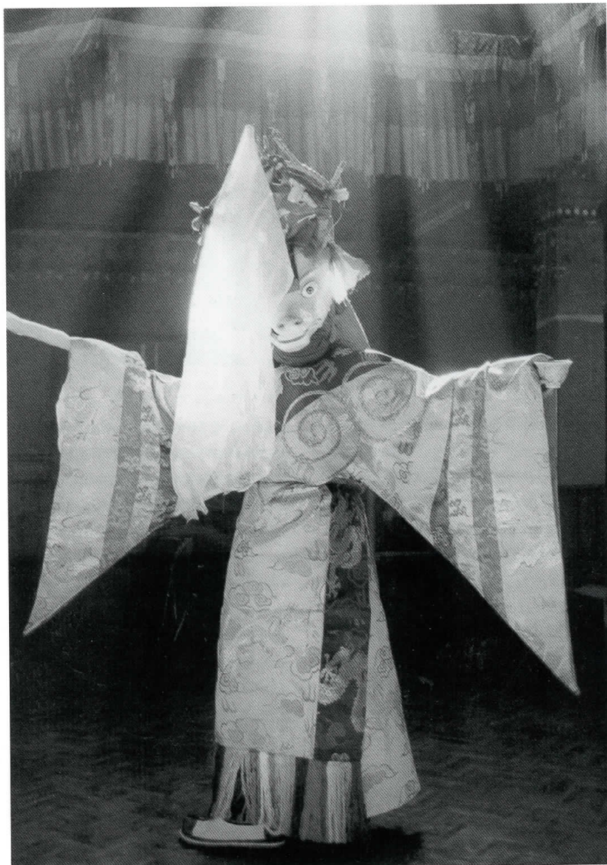
Cham danse har tidligere været forbeholdt munkene, men på Khachoe Ghakyil nonnekloster i Nepal er der nu mange nonner, som danser disse traditionelle religiøse danse.

Igennem de sidste årtier er det en stigende tendens, at størstedelen af munkene i de tibetanske klostre i Kathmandu dalen er børn fra de nordlige Himalaya områder i Nepal. De fleste tibetanske flygtninge i Nepal ønsker ikke længere at indskrive deres børn i et kloster. Livsforhold i det moderne samfund i Nepal er medvirkende