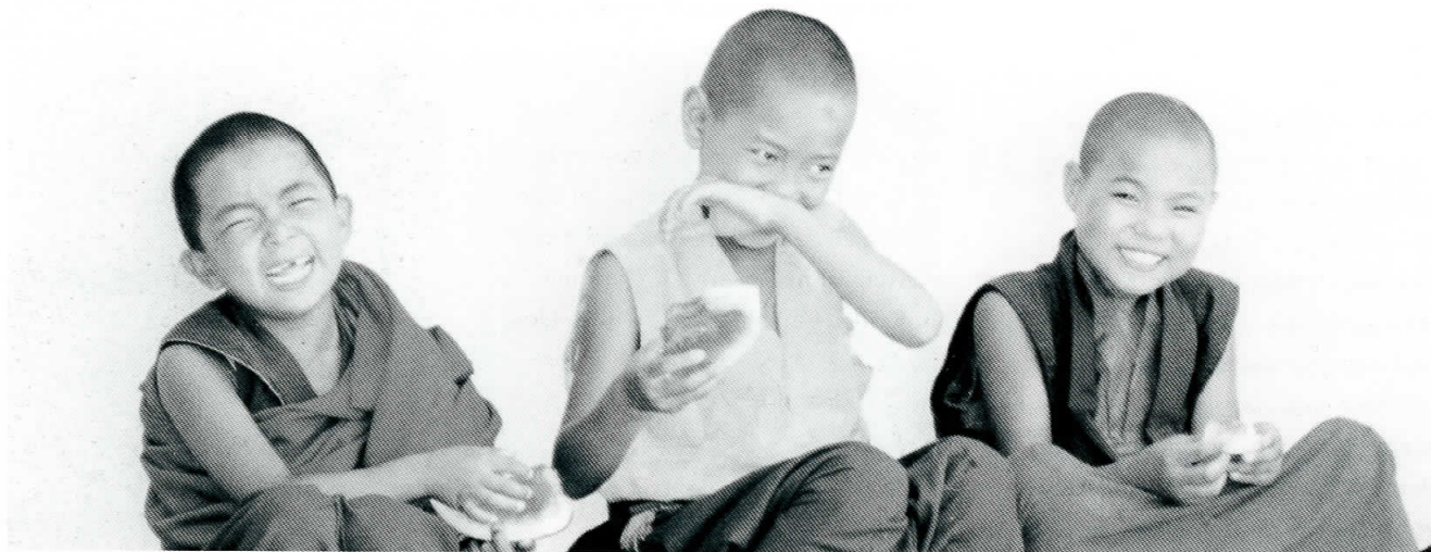
Tre børn fra Khacho Ghakyil nonnekloster nyder deres frokostpause.

Nubri, Dolpo og Yolmo (sherpaer). De fleste unge piger kommer fra fattige landområder og har sjældent gennemgået flere end nogle få års skolegang. Enkelte af pigerne er opvokset i byområder og de har som regel fuldført 5. eller 8. klasse i en almindelig nepalesisk skole. I så tilfælde kan de læse og skrive nepalesisk og sommetider engelsk, men ikke tibetansk.