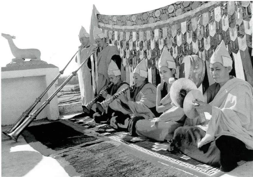
I de tibetanske klostre bliver der spillet på mange forskellige instrumenter. Her spiller nonner fra Khachoe Ghakyil nonnekloster på gyaljen, tromme og cymbaler.

imidlertid også, at nonner i Tibet ikke havde mulighed for at opnå fuld ordination i den buddhistiske tradition, og var derved udelukket fra at få en uddannelse i højere buddhistisk filosofi. Det er i dag muligt for buddhistiske nonner at tage den fulde ordination som nonne (gelong-ma) i Hong Kong ved en kinesisk buddhistisk tradition, men støttet af Dalai Lama bliver det måske muligt engang i fremtiden at finde en løsning på dette problem.