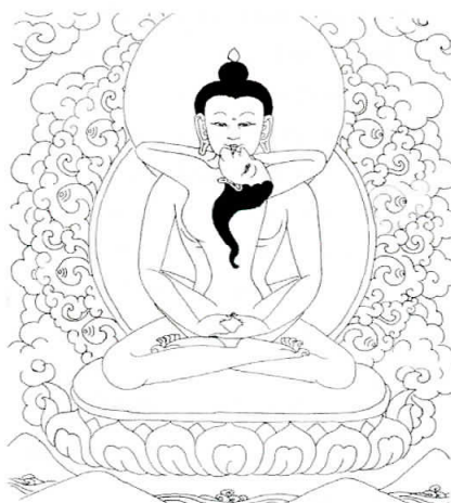
Guru Rinpoche yab-yum - (Guru Rinpoche i tantrisk seksuel forening med sin kvindelige partner Yeshe Tsogyal)

Den sidst nedskrevne tantra tekst i Indien er Kalachakra Tantra, som dateres til midten af det 11. årh. Kalachakra teksten er skrevet på klassisk sanskrit, og introducerer politiske og astrologiske aspekter, som ikke er fundet i andre tidligere tekster, bl.a. ved at der er i teksten kan læses advarsler mod en fremtidig muslimsk invasion. Teksten er en syntese af både hinduistiske og buddhistiske guddomme, som man ved en forenet påkaldelse kan anmode om hjælp til at forhindre truende muslimske invasioner.