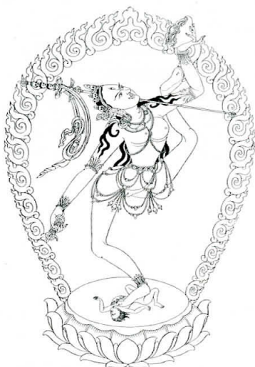
Dorje Pagmo dancing - (Dorje Naljorma ses her i en frydefuld dans, mens hun drikker nektar fra en skål lavet af et kranie)

heldigt for eftertiden, da specielt Nalanda universitetet, inklusive dets omfattende bibliotek, blev totalt udsløjet under de muslimske invasioner i Nordindien i det 12. årh.. Selvom der i nogle århundreder forinden var tegn på nedgang i den buddhistiske aktivitet, satte de muslimske invasioner og omfattende forfølgelse af andre trosretninger på det tidspunkt et definitivt punktum for buddhismens udbredelse i Nordindien. I dag er originale tantriske tekster kun bevaret i Tibet, Kina, Bhutan og Mongoliet. Tibetansk Vajrayana findes også i Ladakh (Nordindien), Sikkim og Nepal samt i Mongoliet.