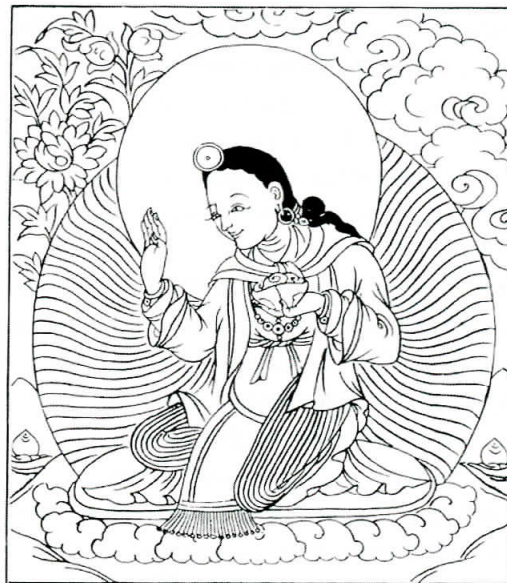
Yeshe Tsogyal - (Guru Rinpoches consort Yeshe Tsogyal)

En del personer har i tidens løb markeret sig som markante tantrisk praktiserende. I perioden 9. til 12. århundrede levede, der i Indien en gruppe yogier, som traditionelt blev kaldt for de 84 maha siddhas (yogier der har opnået speciel spirituel styrke). Disse yogier rejste rundt uden fast tilholdssted og provokerede det etablerede samfund med deres bizarre opførsel og levevis. Ud fra et tantrisk ideal var det at overskride tabu og konventionelle grænser en del af erkendelsesprocessen, for eksempel at indlede tantrisk seksuel adfærd med lavkaste kvinder, spise urent kød (hundekød og lignende) eller udføre meditativ praksis på gravsteder, som i henhold til daværende braminske kaster i Indien var stærkt forurenede steder. Gennem denne livsstil udfordrede og latterliggjorde disse yogier datidens stramme kasteopdelte samfund i Indien. Historien om den kendte siddha Naropa illustrerer effektiviteten i de tantriske metoder. Naropa var en anerkendt og meget respekteret abbed ved det kendte Nalanda universitet, men først efter han mødte sin guru, siddhaen Tilopa, og efterfølgende brød med de etablerede monastiske regler og praktiserede tantrisk meditation, var han i stand til at give slip på tilknytningen til sin intellektuelle viden, og derved opnå højere spirituel erkendelse. Set fra det etablerede samfunds perspektiv blev sådanne personer ofte betragtet som vanvittige. Andre kendte og nu respekterede yogier med såkaldt vanvittig visdom er Guru Rinpoche (Tibet 9. årh.), Drukpa