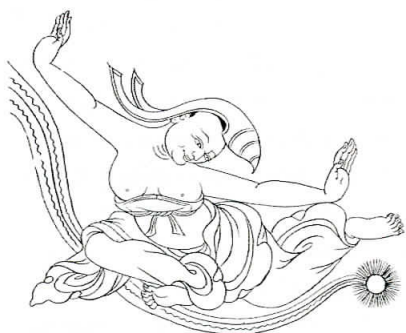
Flying yogi - (Yogi flyvende på regnbuens stråler)

Vajrayana tilhængere og praktiserende findes også i lande som Kina, Korea og Japan.