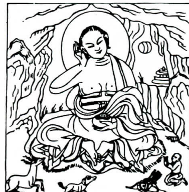
Milarepa - (Tibet store yogi Milarepa, som levede i afsides Himalaya regioner og spiste brændenælder, for ikke at bruge tid på verdslige anliggender, så han fuldt ud kunne hellige sig meditation. Milarepa er især kendt for sin poetiske formidling af buddhismen).