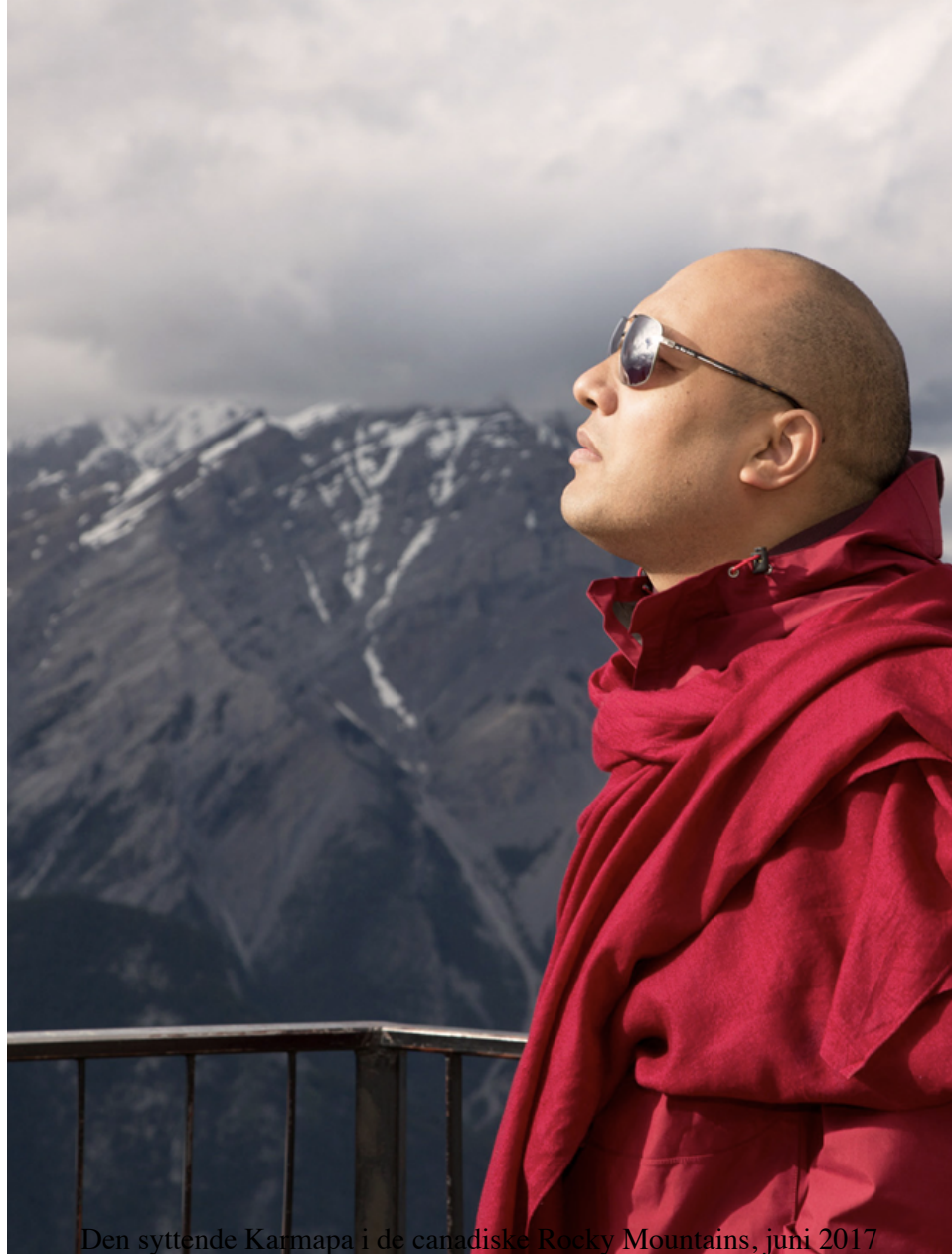
Den syttende Karmapa i de canadiske Rocky Mountains, juni 2017