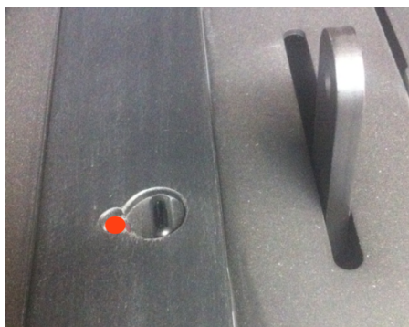
Röd lampa vid IR-öga indikerar behov av återställning/omstart