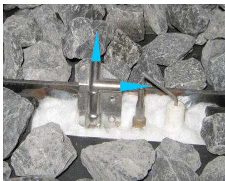
Tändbrännare med blå pilotlåga

När brännaren sedan en gång startat så tänds den alltid vid första tillfället om den används någon eller några gånger per vecka.