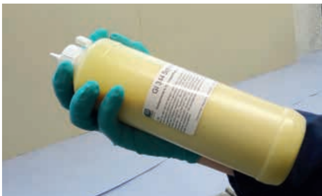
5. Ryst intensivt [20 sek.] til farven er ensartet