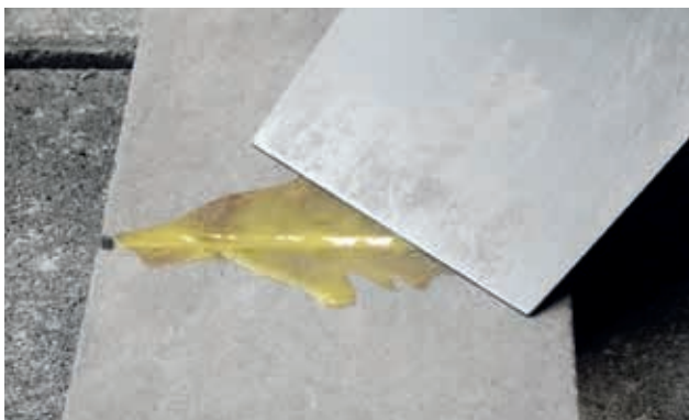
7. Fjern overflødig produkt med en spartel