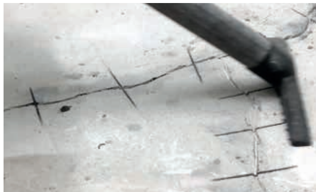
2. Støvsug revner