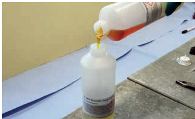
4. Hæld resin og hærder sammen og ryst