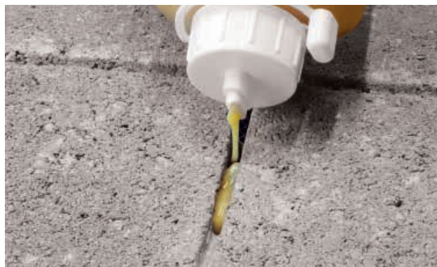
6. Fyld revner og tværsnit direkte fra tuden