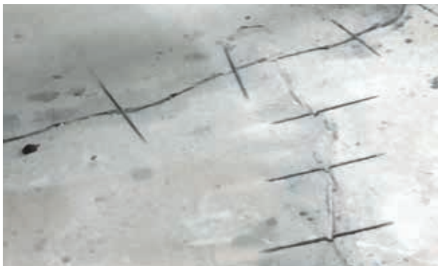
1. Oprens revner og lav tværsnit