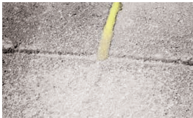
8. Strø oventørret kvartssand på overfladen, Færdig!