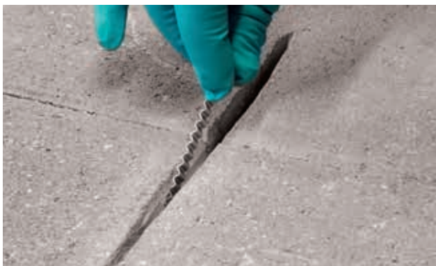
3. Montér rustfri stålarmering i tværsnittene