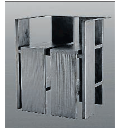
Rasmus Bækkel Fex + Please Wait to be Seated.