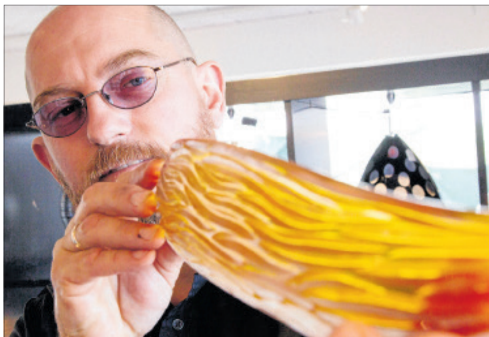
Alt efter størrelsen ligger prisen på et skib forarbejdet af glas og eg som ædelt håndværk på Hundested Havn på et sted mellem 18.000 og 90.000 kroner.