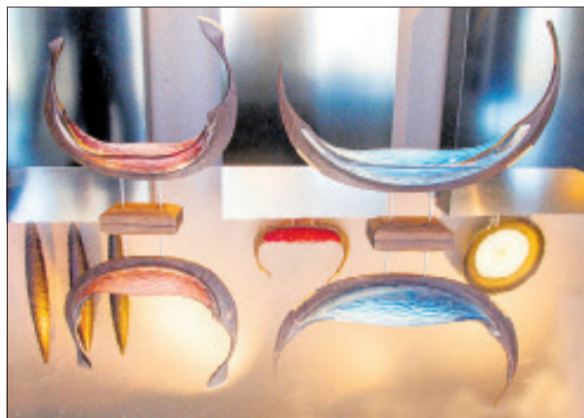
Nu har Glassmedjen i samarbejde med naboværkstedet Egeværk fået succes og international opmærksomhed ved sammen at forarbejde unikke vikingeskibe af håndpustet glas og eg.