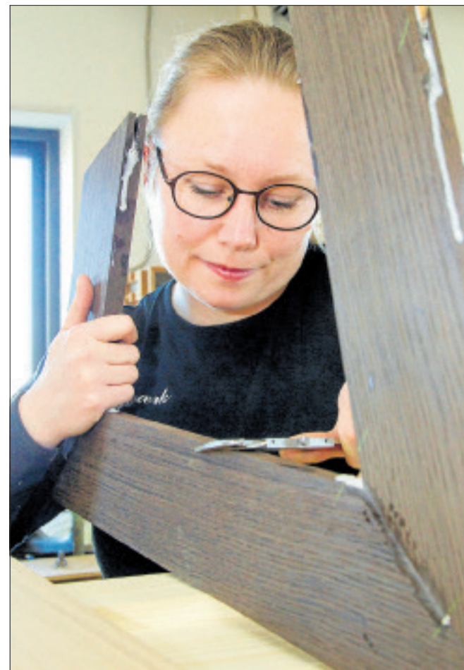
Det er unikt håndværk. Som eksempel koster en af Egeværks unikke stole på den lune side af 100.000 kroner.