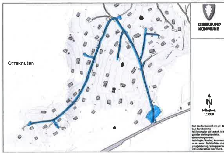
Figur 1 Kart over veiene som Egelandsdal hytteforening, ifølge tinglyst avtale fra 2017, har bruksrett til og vedlikeholdsansvar for (merket blått på kartet).