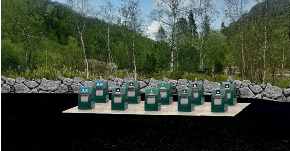
Figur 3 Illustrasjon av DIM's planlagte bruk av nedgravde søppel-kontainere.