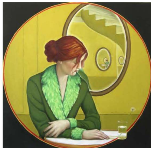
Edgardo Navarro Cycle I , 2014 oil on canvas, 100 x 100 cm

In this open story, where each painting would come to enrich a new episode or a new turn of events, one imagines identifying wise men or magnates who have escaped from a studio in Babelsberg or Billancourt in order to ally with South American dictators or masters of the world hidden behind sunglasses. In the midst of this theatre, the figure in counter relief or subjective camera, a Tintin and Burroughs fuelled hero endeavouring to unveil the secret even if it meant biting into a mushroom and seeing his image disappear in a mirror, or watching, fascinated, as spells are cast on bizarre characters. The precision in the depiction of architectural or clothing details enforces the marvellous character of this swaying from a timeless reality to an unknown destination.