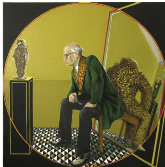
Edgardo Navarro Feedback , 2014 huile sur toile, 200 x 200 cm

En prenant les choses autrement, on pourrait dire que Navarro trace un parcours pas très rectiligne entre Neue Sachlichkeit et peinture métaphysique et plus généralement à travers ces courants picturaux longtemps occultés par la puissance de feu du modernisme. Mais ces peintures témoignent aussi d'une fascination pour les tableaux à l'énigme de la Renaissance (quand les ambassadeurs portaient eux aussi des manteaux de fourrure), tout en rendant compte d'une réalité plate aux tonalités ocre, brune et noire sur lequel il balade son projecteur poursuite; à moins que ces cercles de lumière ne soient un rappel des séances de lanterne magique.