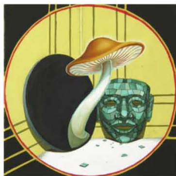
Edgardo Navarro, Angle Mystique IV , 2014 huile sur toile, 45 x 45 cm

Dans ce conte ouvert, que chaque tableau viendrait enrichir d'un nouvel épisode ou d'une nouvelle bifurcation, on croit identifier savants ou magnats échappés d'un studio de Babelsberg ou de Billancourt pour s'allier à des dictateurs sud-américains ou des maîtres du monde abrités derrière des lunettes de soleil. Au milieu de ce théâtre, la figure en creux ou en caméra subjective d'un héros nourri de Tintin et de Burroughs qui s'efforce de percer le secret, dut-il pour cela croquer dans un champignon et voir son image disparaître au fond d'un miroir, ou bien assister fasciné aux sortilèges qui frappent de bien curieux personnage. La précision dans le rendu de détails architecturaux ou vestimentaires renforce le caractère merveilleux de ce basculement d'un réel indatable vers une destination inconnue.