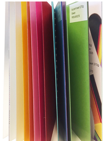
Kernefarver til MultiLoft - 3-lags specialpapir med farvet kerne