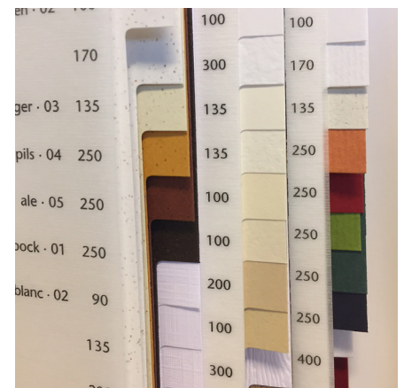
En gramvægt på 250g - 350g er ofte den bedste til et visitkort.