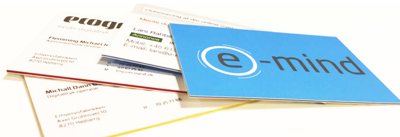
Visitkort trykt på MultiLoft - et helt særligt 3-lags papir med farvet kerne

I denne quick guide tager vi en tur rundt i visitkortets verden og ser lidt på nogle af de vigtigste elementer for at skabe et professionelt visitkort.