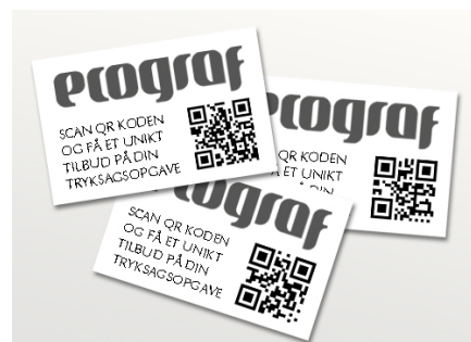
Visitkort med QR koder