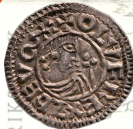
Sveriges första mynt från år 995

Sedan kallades de för daler, och senare för riksdaler. Namnet kronor har våra mynt haft sedan år 1873, och silverhalten i mynten försvann helt omkring 1970.