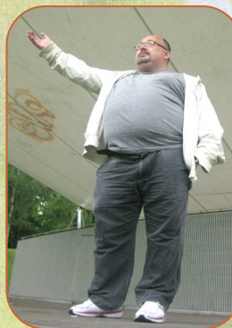
Måne en blivande programledare för Kulljuli?

Nöjesgrytan Kul i juli firar i år 44 år, varav 24 med mig som producent och programledare.