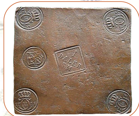
Plåtmynt från 1600-talet som kunde väga upp till 19 kg

Förr så fanns det flera olika sorters mynt i Sverige. En sorts mynt an-