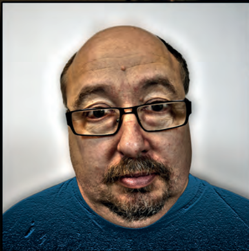
Känd Norrehedsprofil i annat ljus....