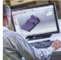
F & E-Zentrum