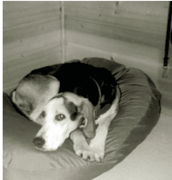
Klang II, født i 1984