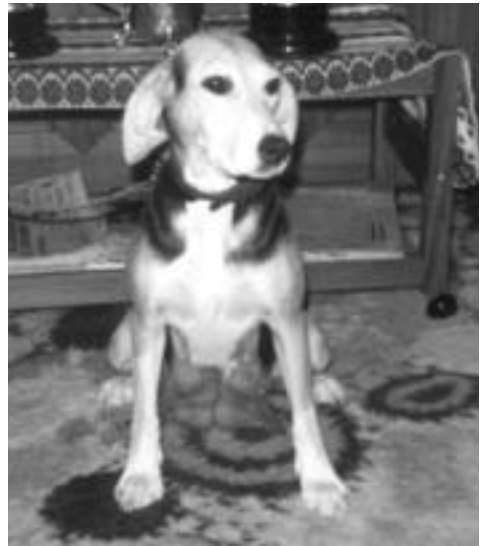
JUCH Fanta 619/77