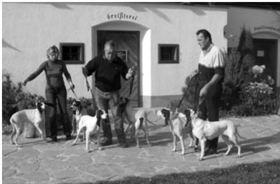
Fransk koppel av rase Chien d'Ariegeois

Allerede onsdag 18.10. kl. 07.00 dro vi, 4 mann og to hunder, fra Gardermoen med kurs for Brandlucken i Almenland i Styria (en region i Østerrike).