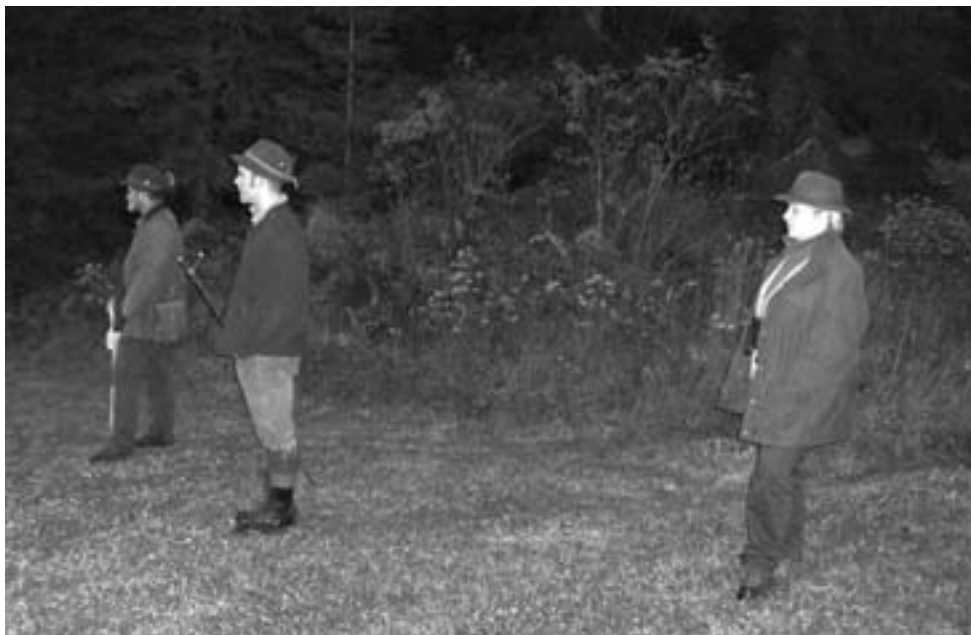
Dommere og kjentmann på første slipp prøvedagen.