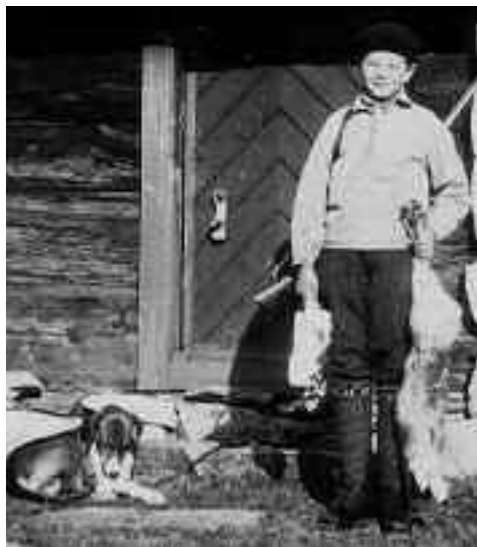
Jens Anton Poulsson med sin første hare, 11 år gammel i 1929.