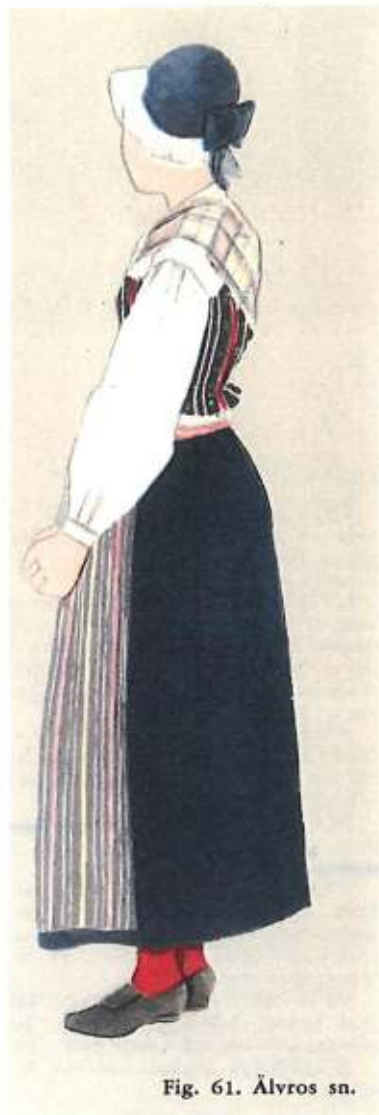
Fig. 61. Älvros sn.