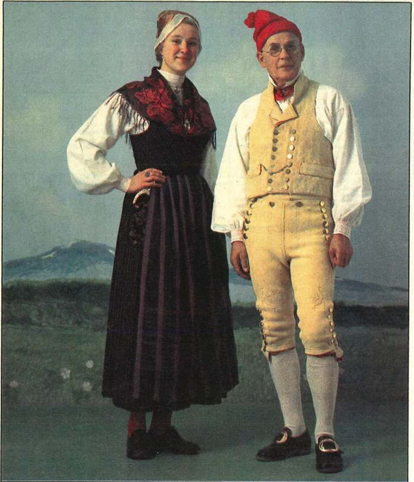
Kvinnodräkt och mansdräkt från Lillhärdal