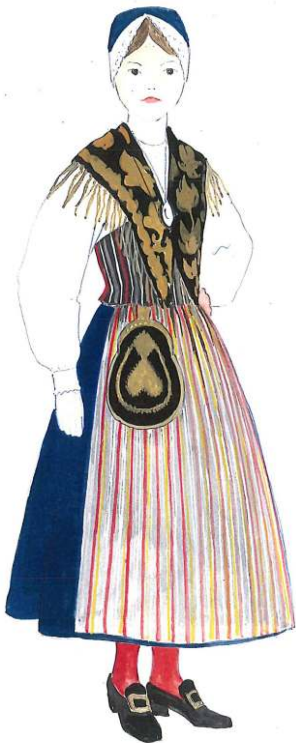
SKJORTA, VITT LINNE