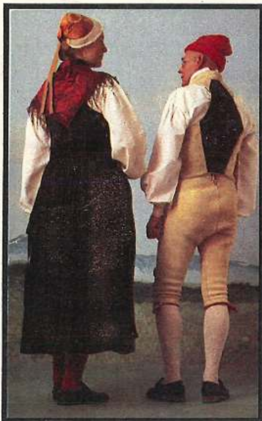
Bildarrangemang, bakgrunder: AGNETA TORESKOG Dräktsakkunnig: EDIT THIVALL Texter: IRIS MATSSON

Älghudsvästen är dubbelknäppt och har också uppstående krage. Fickor och krage är kantade i rött. Byxorna har lucka och är fint laskade. Strumpeband, vita strumpor, svarta handsydda skor med nävermellansula. På huvudet en röd stickad mössa.