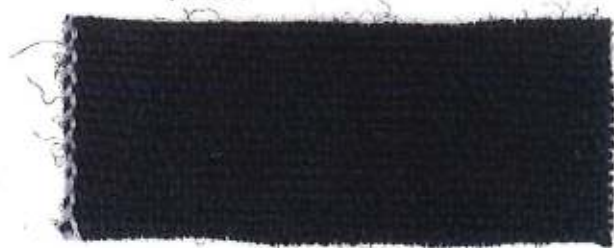
KJOL, MÖRKBLÅ VADMAL