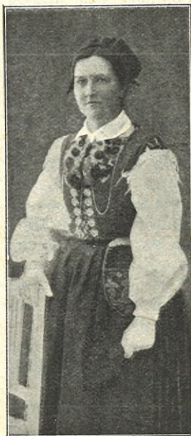
FLICKA I SUNDBORN-DRÄKT.

Att för öfrigt genomförandet af reformen med afseende på "hvad folk skall säga" är ofantligt mycket lättare nu (och detta i all synnerhet hvad sommardräkten beträffar) än bara för ett tiotal år sedan, är tydligt, då ju faktiskt allmogedräkter under tiden kommit mer och mer i bruk hos icke-allmoge, och om man ock allt fortfarande här och där hugnas med undrande blickar, så sätter man sig naturligtvis däröfver, när man vet, att man verkar för en fosterländsk sak, ty som sådan måste man anse motarbetandet af denna vanvettiga lyx, som alltmer breder ut sig och genomtränger alla samhällslager. Nej, ärade läsarinna, du behöfver ej alls