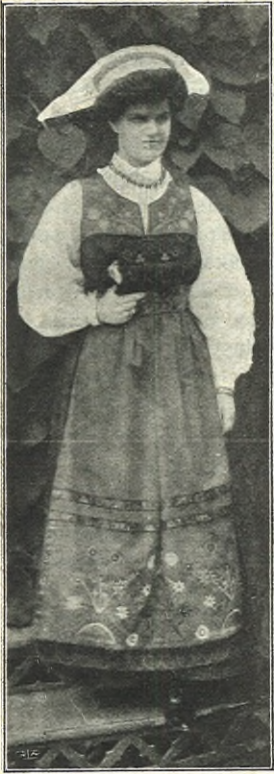
PRINCESSAN MARIA I ÖSTERÅKERSDRÄKT.