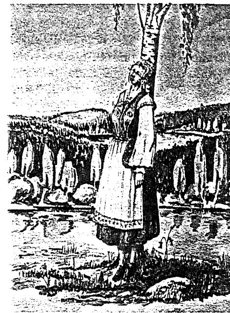
Förslag till folkdräkt för Södra Vedbo härad. Akvarell utförd av Ragnar Lindahl på 1930-talet. Originalen förvaras hos Mariannelund-Hässlebys hembygdsförening.

I början av 1970-talet aktualiserades dräktforskningen igen, beroende på att flera personer sade sig intresserade av att bilda en studiecirkel i ämnet. Vuxenskolan åtog sig det administrativa och Stig Lindhede på Hemslöjden i Eksjö lovade ställa upp