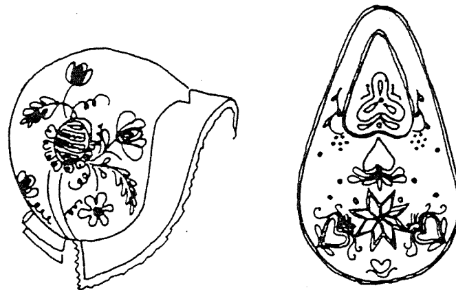
Bindmössa och kjolväska till Södra Vedbodräkten.

Sedan detta skrevs har vi också funnit originalet till bindmössan och lyckats göra en exakt kopia av den. Till mössa och väska finns material i Garnshopen, S Storgatan 13, Eksjö. Tyg till grön dräkt och förkläde finns i Hemslöjden i Eksjö, medan tyg till randig kjol + livstycke + vit schal och vitt förkläde finns hos Hemslöjden i Jönköping. För närmare upplysningar: Margit Liderfelt 0381/101 65.