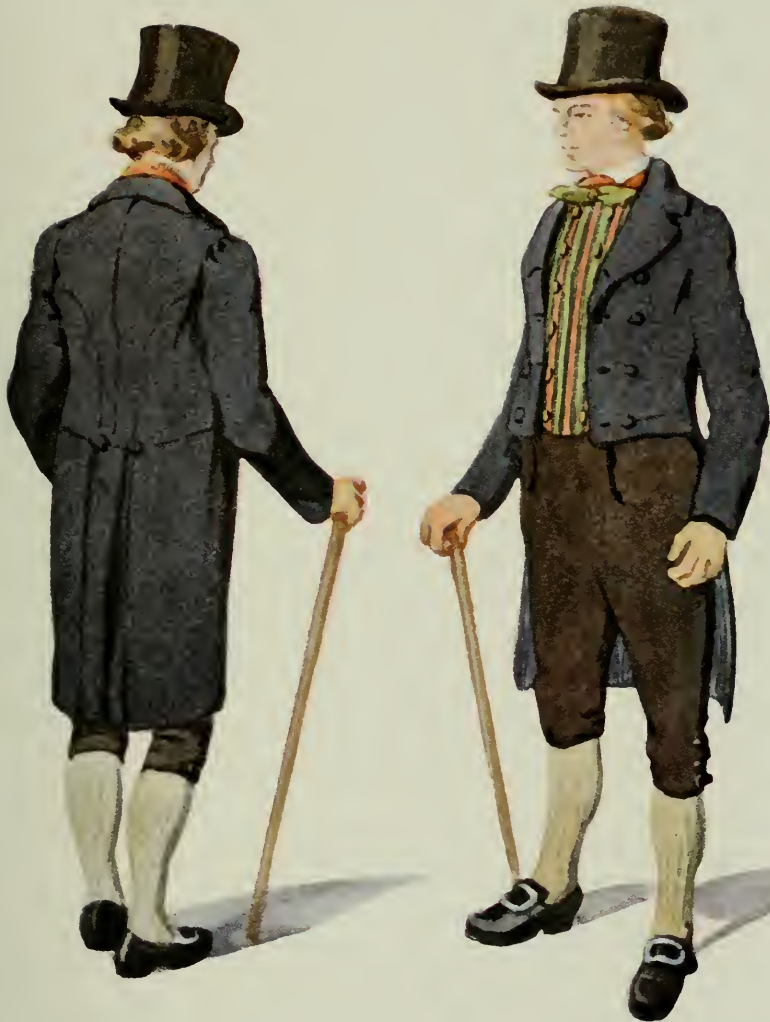
HÖGTIDSDRÅKT. Ydre hd, Östergötland. Efter original i Nordiska Museet.