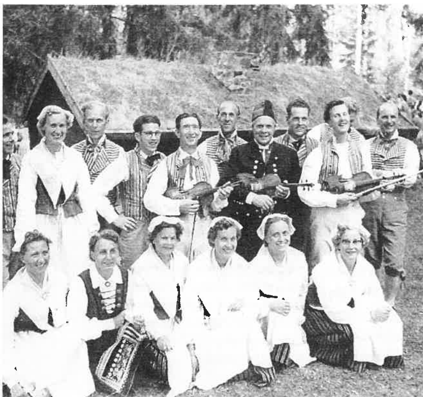
Virserums folkdanslag i Aspelandsdräkter framför Tildas stuga i hembygdsparken år 1955. Andra kvinnan från vänster nedtill bär Värendsdräkt.

slets ut och återanvändes till slut som lappar eller lump. På bevarade teckningar och målningar var människor ofta finklädda, även om de utförde arbete. Därför är vår kunskap bäst om högtidsdräkter. På bevarade fotografier bär kvinnor oftare än män traditionell dräkt. Mäns dräktskick har varit mer påverkat av borgerligt och militärt mode.