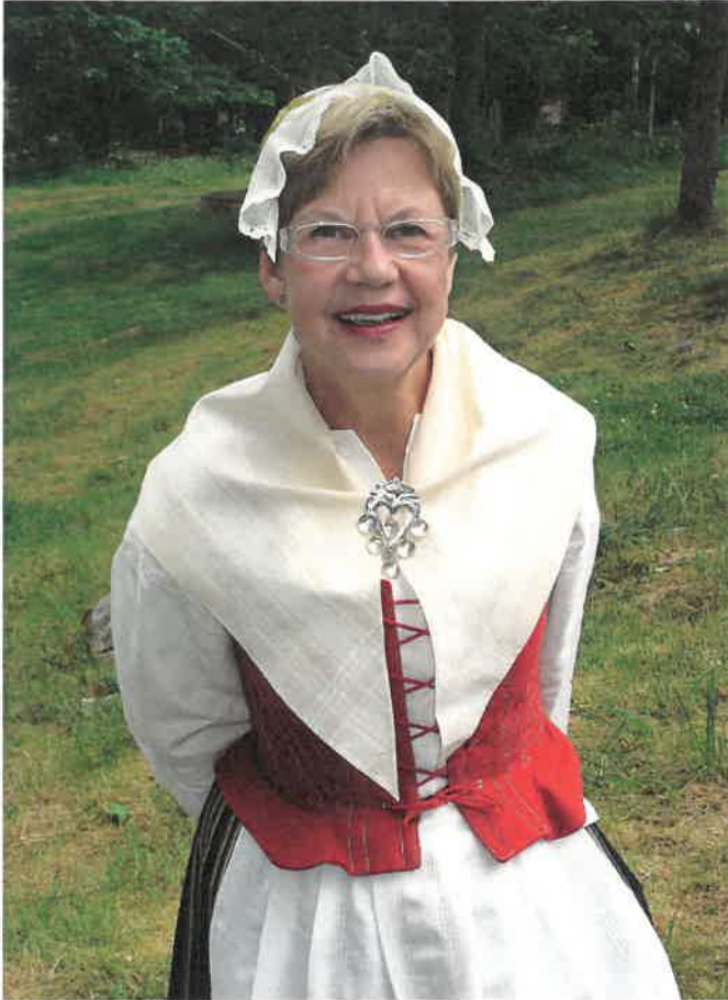
Den kvinnliga Aspelandsdräkten med det speciella halsklädet som hålls samman med sölja av silver. Randig halvylllekjol i svart, blått, gult och rött. Livstycke i rött halvyllle med mönsterstickningar och skört. Vitt förkläde med myggtjällsränder. Halskläde av oblekt och blekt bomullsgarn med tambursömsbroderier på snibben.

En genomgripande förändring för allmogens dräktskick kom i mitten av 1800-talet. Industrialism, frihandel och ökad möjlighet att resa gjorde kläder och industriellt tillverkade textilier till låga priser tillgängliga på landsbygden. Det blev ett hårt slag mot självhushållets dräktkultur som försvann nästan överallt.