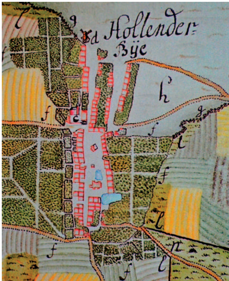
Dette kort viser de mange gårde og huse i Store Magleby, omgivet af havearealer og bymark. Foroven – i byens sydlige udkant – ses møllen. Udsnit af kadetkort fra omkring 1740 af Torban Knorr, Det kgl. Bibliotek.

blive gårdmand/gårdmandskone i en af landsbyerne i Tårnby sogn, eller man kunne flytte til Dragør og ernære sig ved et maritimt erhverv, og som den sidste udvej kunne man glide ned i husmandsstanden i Hollenderbyen som håndværker. Der var derfor i disse år en markant udvandring af unge mennesker fra Store Magleby, og der var for dem ingen vej