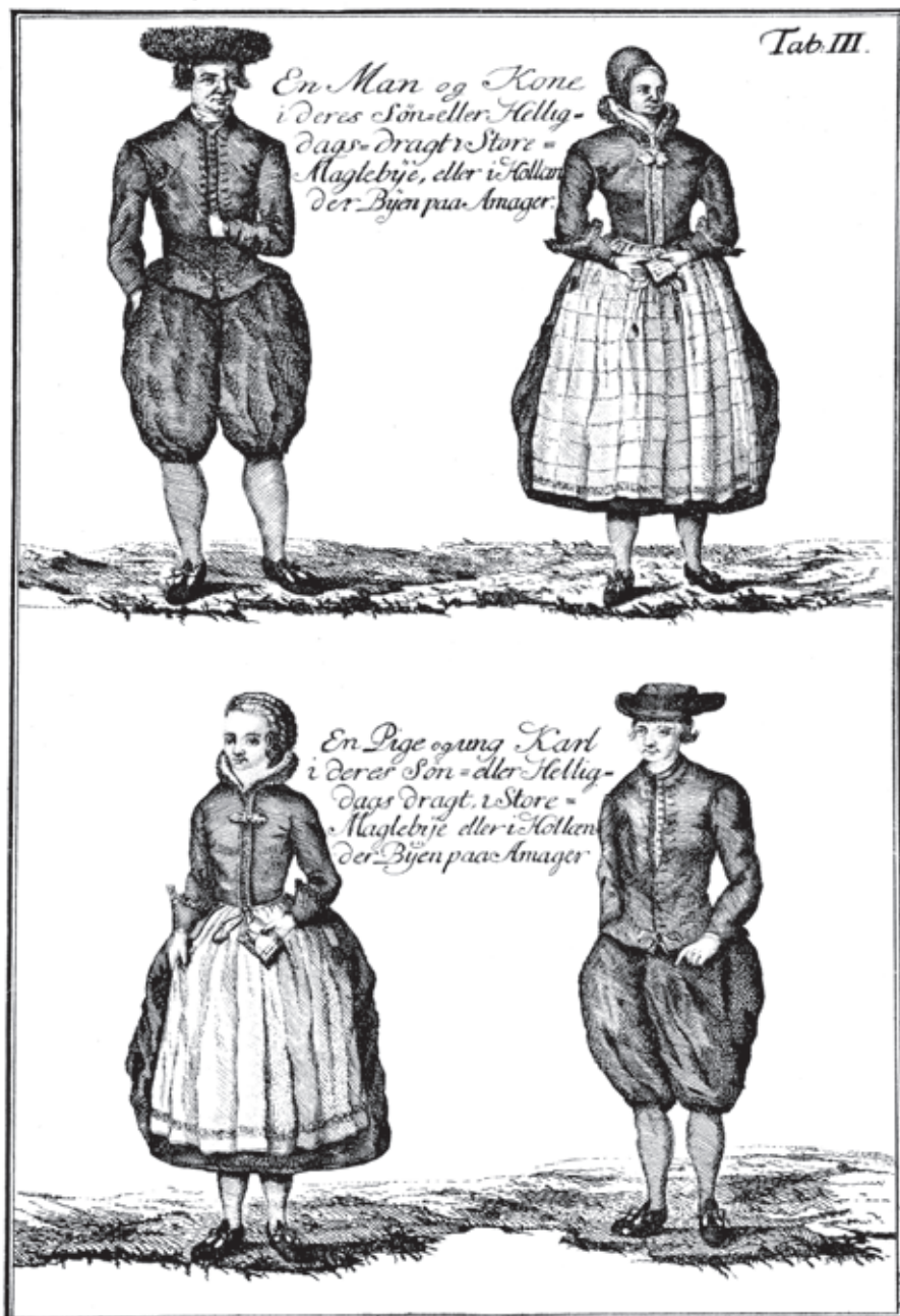
En mand og en kone, samt en karl og en pige fra Store Magleby. Illustrationen er gengivet i: Laurids de Thurah: Omstændelig og Tilforladelig Beskrivelse over den liden Æ Amager og den ei langt derfra situerede endnu mindre Æ Saltholm , 1758, genoptrykt 1968.