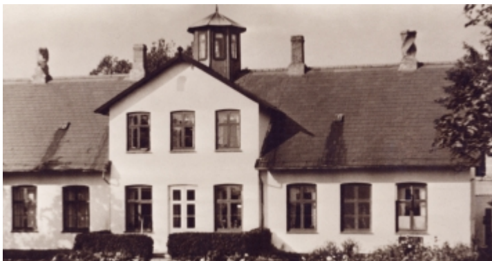
Aflandshagegård på det sydvestlige Amager med to snoede skorstene. Foto ca. 1955.