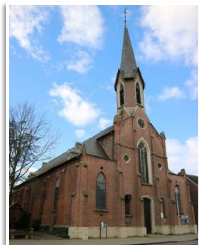
Parochiekerk Sint-Jan Evangelist