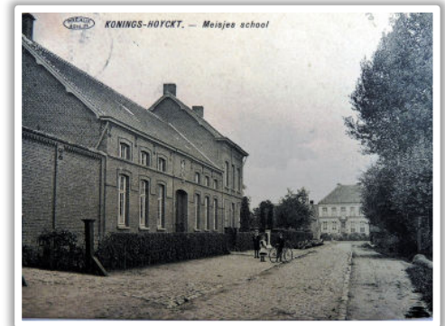
Schoolstraat (ca 1900) met links de meisjesschool en zicht op oude directeurswoning (jongensschool)

Stap nu links de Schoolstraat in, voorbij de H. Hartschool , de voormalige meisjesschool, waar Hooikste kleuters en lagereschoolkinderen, ondertussen al jaren gemengd, schoollopen. Aan het einde van de straat (240m) Kom je opnieuw aan het Dienstencentrum in de Dorpsstraat en ben je aan de finish van de wandeling gehaald.