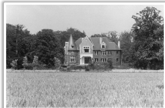
Het kasteel van