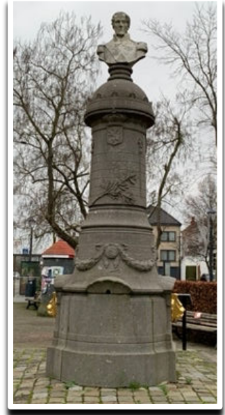
Koning Leopold I

Neem de tijd om even rond het plein te wandelen en loop rechtsaf tot aan de stadspomp met bovenaan de buste van Koning Leopold I. Volgens de Ferrariskaart (1771-1778) lag hier een vijver. Volgens de geschiedenis van de pomp werd de bouw gestart in 1780, ter vervanging van een oude waterput, die de belangrijkste waterbron was in het dorp en eigendom van de nabijgelegen brouwerij Verbesselt of De Belser . Met de aanleg van de Mechelbaan in 1869 werd deze put dichtgegooid. De pomp werd op 7 juli 1872 plechtig ingehuldigd en voorzag vanaf dan het dorp - en de brouwerij - van drinkbaar water. Op de plaats van de brouwerij (rechts van de pomp) staan nu appartementen.