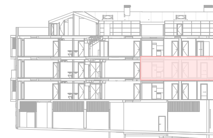
2 CCC SEC.A2.2 CCA22 1 : 500