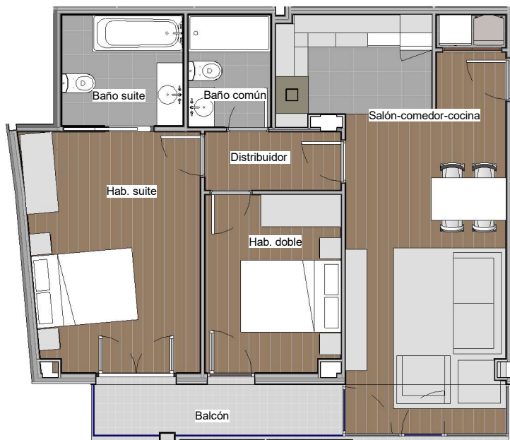
1 CCA P00 A2.1 CCA21 1 : 100