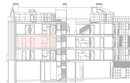
2 CCC SEC.A2.1 CCA21 1 : 500

El presente plano no es definitivo, ya que ha sido elaborado conforme el Proyecto Básico del Edificio y, por tanto, Grupo Promotor Hiperauto, S.L. se reserva la facultad de incluir las modificaciones necesarias por exigencias técnicas y/o jurídicas u ordenadas por cualesquiera administraciones u organismos públicos, ajustándolo en todo caso al Proyecto de Ejecución. Los elementos accesorios (por ejemplo, el mobiliario, incluido el de la cocina), son meramente ilustrativos. Los giros de puertas y la distribución de aparatos sanitarios no son vinculantes. Las superficies expresadas son aproximadas, pudiendo experimentar modificaciones por razones de índole técnicas y/o legal en el desarrollo de la ejecución de las obras.