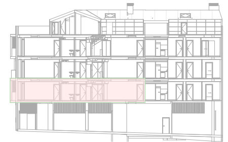
2 CCC SEC.A1.3 CCA13 1 : 500

El presente plano no es definitivo, ya que ha sido elaborado conforme el Proyecto Básico del Edificio y, por tanto, Grupo Promotor Hiperauto, S.L. se reserva la facultad de incluir las modificaciones necesarias por exigencias técnicas y/o jurídicas u ordenadas por cualesquiera administraciones u organismos públicos, ajustándolo en todo caso al Proyecto de Ejecución. Los elementos accesorios (por ejemplo, el mobiliario, incluido el de la cocina), son meramente ilustrativos. Los giros de puertas y la distribución de aparatos sanitarios no son vinculantes. Las superficies expresadas son aproximadas, pudiendo experimentar modificaciones por razones de índole técnicas y/o legal en el desarrollo de la ejecución de las obras.