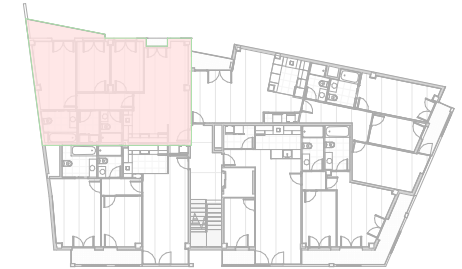
3 PLANTA PRIMERA CCA12 1 : 500