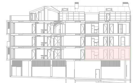
2 CCC SEC.A1.2 CCA12 1 : 500

El presente plano no es definitivo, ya que ha sido elaborado conforme el Proyecto Básico del Edificio y, por tanto, Grupo Promotor Hiperauto, S.L. se reserva la facultad de incluir las modificaciones necesarias por exigencias técnicas y/o jurídicas u ordenadas por cualesquiera administraciones u organismos públicos, ajustándolo en todo caso al Proyecto de Ejecución. Los elementos accesorios (por ejemplo, el mobiliario, incluido el de la cocina), son meramente ilustrativos. Los giros de puertas y la distribución de aparatos sanitarios no son vinculantes. Las superficies expresadas son aproximadas, pudiendo experimentar modificaciones por razones de índole técnicas y/o legal en el desarrollo de la ejecución de las obras.