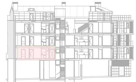
3 CCC SEC.A1.1 CCA11 1 : 500

El presente plano no es definitivo, ya que ha sido elaborado conforme el Proyecto Básico del Edificio y, por tanto, Grupo Promotor Hiperauto, S.L. se reserva la facultad de incluir las modificaciones necesarias por exigencias técnicas y/o jurídicas u ordenadas por cualesquiera administraciones u organismos públicos, ajustándolo en todo caso al Proyecto de Ejecución. Los elementos accesorios (por ejemplo, el mobiliario, incluido el de la cocina), son meramente ilustrativos. Los giros de puertas y la distribución de aparatos sanitarios no son vinculantes. Las superficies expresadas son aproximadas, pudiendo experimentar modificaciones por razones de índole técnicas y/o legal en el desarrollo de la ejecución de las obras.