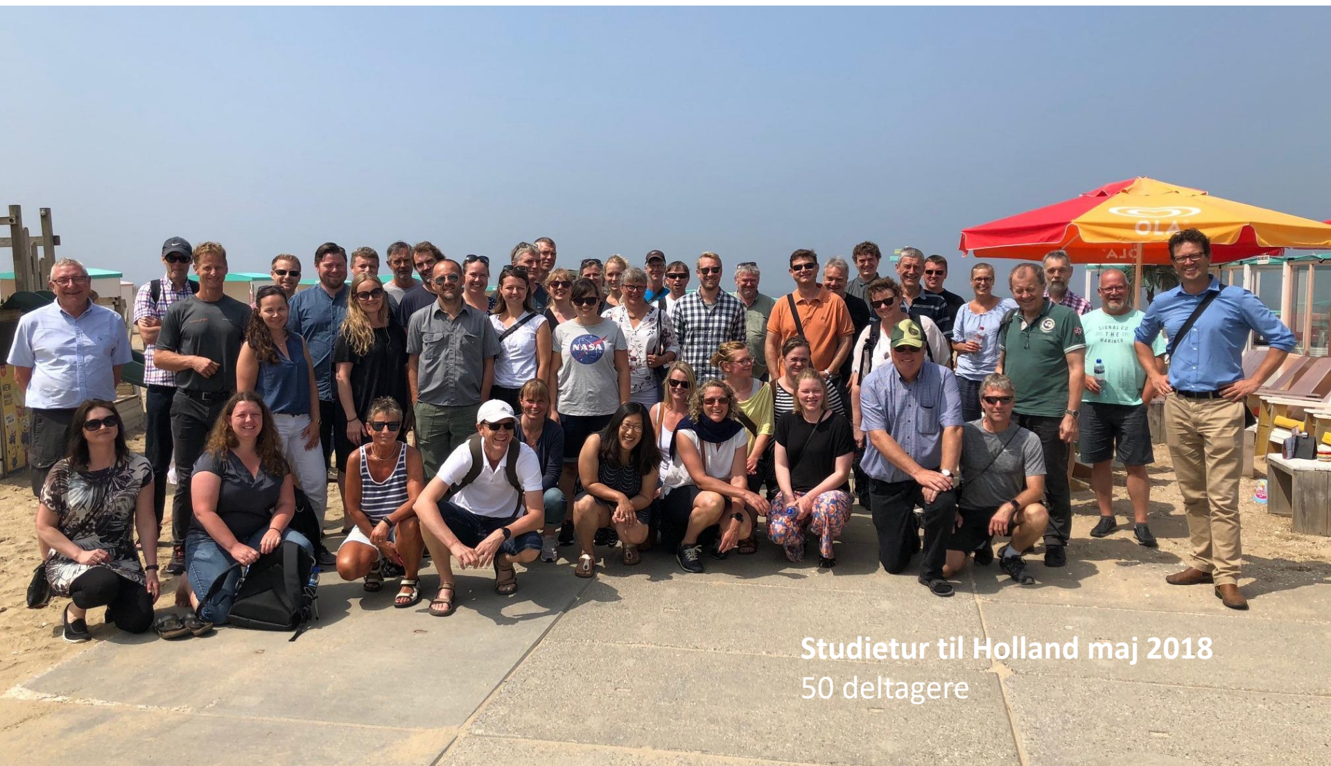
Studietur til Holland maj 2018 50 deltagere