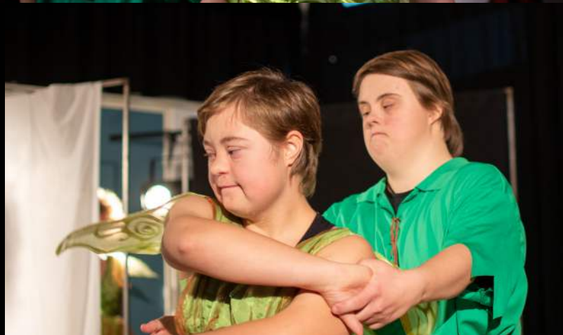
STILLBILLEDER FRA FORESTILLINGEN "PETER PAN", EFTERÅR 2021