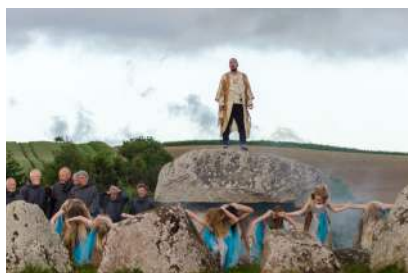
Myten om stenene (2016)