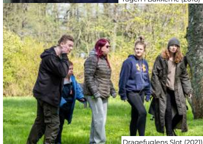
Dragefuglens Slot (2021)