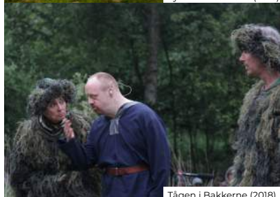
Tågen i Bakkerne (2018)