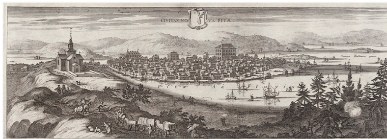
Piteå slutet på 1600-talet — bilden kommer från Erik Dahlbergs bildverk Suecia Antiqua et Hodierna utgiven 1716

Piteborgare är en kartläggning av Piteå Stads befolkning mellan år 1621 till ca år 1815.