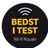
Bedste wi-fi Router