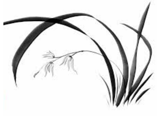
Orchidee met de lente