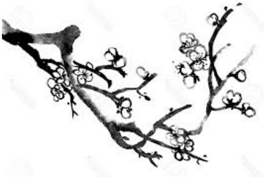
Pruimen bloesem met winter