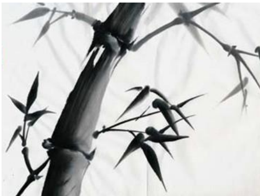
Bamboe met de zomer