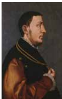
René van Chalon

Anna van Lotharingen (†1568), echtgenote van René van Chalon, werd in het koor van de kerk van het Minderbroederklooster begraven. Haar graf werd tijdens de bezetting van Diest door de geuzen (1580-1583) geschonden. Hierop liet het stadsbestuur Anna van Lotharingen bijzetten in het hoogkoor van de Sint-Sulpitiuskerk. De juiste ligging van het graf weet niemand.