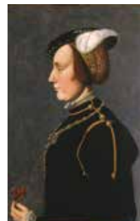
Anna van Lotharingen

René van Chalon was de eerste Nassau die zich ook prins van Oranje mocht noemen. Zo verenigde hij beide titels van het huis van Oranje-Nassau.